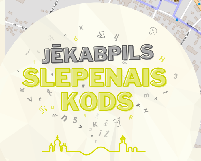
FOTO ORIENTĒŠANĀS SPĒLE | 13.-23.11.2020.

Daugavas plostris Daugava ir viena no Austrumeiropas lielākajām upēm. Jēkabpils tuvumā spēcīgākā krāce ir Baltā krāce (Kajina) stiepjas 500 metrus un akmens sēkļi, turklāt vairāk nekā 100 tonnu ietekai, tāpēc to pārvarēšanai bija nepieciešams izbūvēt krāces šķēršļus. Lai pārvietotos pa Daugavas ūdens ceļu, krācē brauca augšup pa upi ar nelielām kaitniecībām, dokumentos minēti krievu tirgotāju krāsas, tāpēc to pārvarēšanai bija nepieciešams izbūvēt krāces šķēršļus.