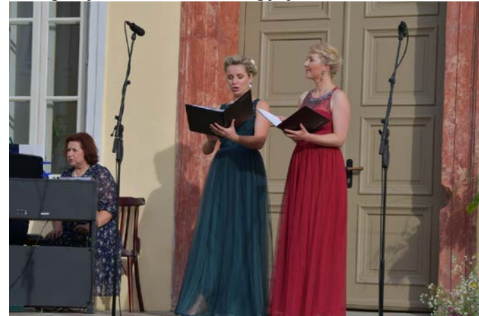
Jēkabpils pilsētas pašvaldības Sabiedrisko attīcību nodaļa

Es ceru, ka šādi koncerti, kas pulcē Jēkabpils talantīģakos solistus, varētu kļūt par jaunu un skaistu tradīciju. Protams, paldies arī solistu vecākiem, pedagogiem un citiem atbalstītājiem, kas ieguldījuši savu laiku un enerģiju jauniešu talantu attīstībā.”