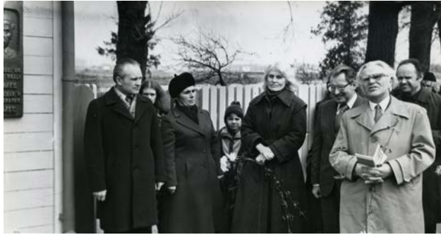
Brāļu Skulmju memoriālās mājas atklāšana

Muzejs paplašināja savu darbību un vairākās ēkās pilsetā tika atvērtas izstāžu zāles un ekspozīcijas.