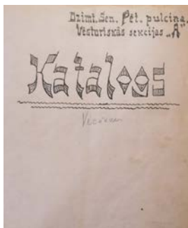
Dzimtenes senatnes pētīšanas pulciņa Vēsturiskās sekcijas „A” katalogs