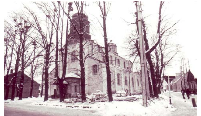
Dievnama kopskats no Brīvības un Katolu ielas krustojuma. 1976. gads

Vēlākajos gados šī ēka bija izmantota kā treniņu zāle smagatļētiem, mēbeļu veikals, konservu fabrikas noliktava.