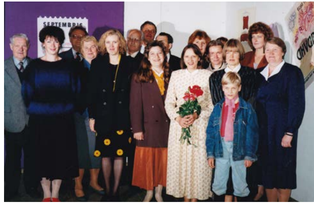
Jēkabpils Vēstures muzeja darbinieki 1996. gada 6. septembrī. Pēdējais foto Brīvības ielā 169/171 pirms pārcelšanās uz Krustpils pili

Ar Jēkabpils rajona Tautas Deputātu padomes valdes 1994. gada 13. aprīļa lēmumu Nr. 056 Jēkabpils Vēstures muzeja valdījumā tika nodota Krustpils pils. Sākās izpētes un atjaunošanas darbi. Šajā gadā par muzeja direktori kļuva Inese Berķe.