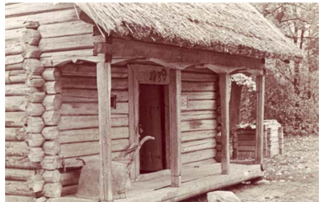
Jēkabpils Vēstures muzeja brīvdabas nodaļa „Sēļu sēta”. 20. gs. 60.–70. gadi

Jau 1949. gadā muzejs pārņēma savulaik Jēkabpili labi zināmā alus darītāja A. Hikšteina 19. gs. 80. gados stādītā parka teritoriju un 1952. gadā sāka tur veidot brīvdabas nodaļu. Gandrīz pašā pilsētas centrā, Filozofu ielā, nu var apskatīt Augšzemei raksturīgās 19. gadsimta celtnes – dzīvojamu māju, graudu klēti, mazo klēti, kalvi, vejdzirnavas un pirti.