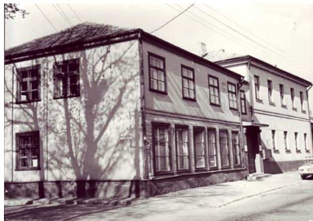
Muzeja ēka Brīvības ielā 169/171. 20. gs. 80. gadi

1933. gadā muzeja vajadzībām piešķīra divstāvu ēku Jēkabpili Brīvības ielā 171.