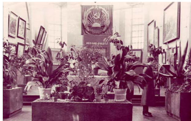
Istabas augu izstāde dievnama ēkā Brīvības ielā 167

1950. gadā Jēkabpils Vēstures muzejam izstāžu rīkošanai tika piešķirta dievnama ēka Brīvības ielā 167.