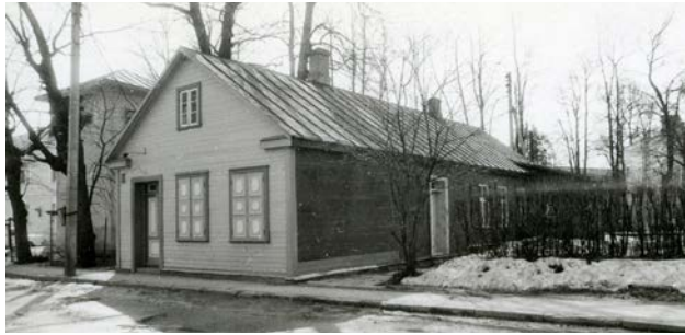
Pētera Sīpolnieka memoriālā māja. Brīvības iela 141. 20. gs. 90. gadi

1981. gada 20. aprīlī atklāja piemiņas plāksni pie ēkas Brīvības ielā 26, kurā dzimuši gleznotāji Oto un Uga Skulmes. Šajā namā atradās memoriālā istaba un neliela izstāžu telpa.