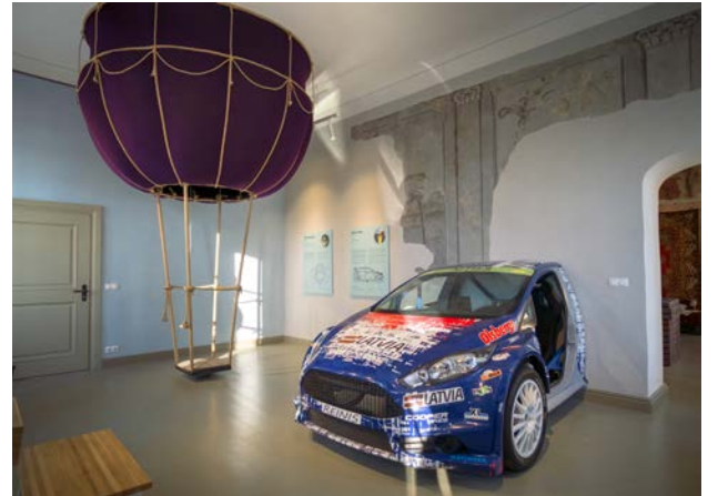
Ieskats jaunizveidotajās ekspozīcijās

un mākslas izstādes. Taču līdz pilnīgai telpu atjaunošanai un iespējai iekārtot jaunu pilsētas vēstures ekspozīciju bija jāpaiet vairāk nekā 20 gadiem.