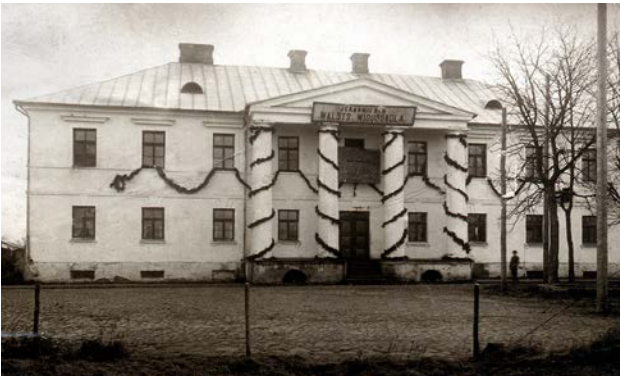
Jēkabmiesta (Jēkabpils) Valsts vidusskola, Pasta iela 1. 20. gs. 20. gadu sākums