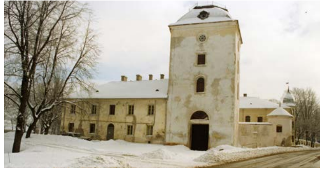
Krustpils pils. 1998. gads

Tika atjaunots pils Vartu tornis, iekārtotas telpas muzeja krājuma glabāšanai, divās pils zālēs rīkotas tematiskās