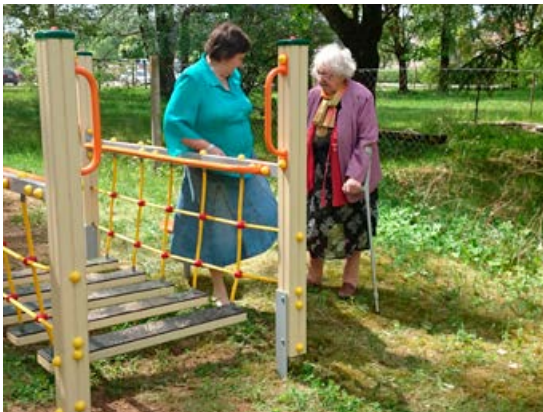
„Palīdzība onkoloģiskajiem pacientiem”, „Atbalsts senioriem” un „Plaukstošu kopienu attīstībai”.

Vienlaikus fonds saglabās trīs programmas NVO atbalstam –