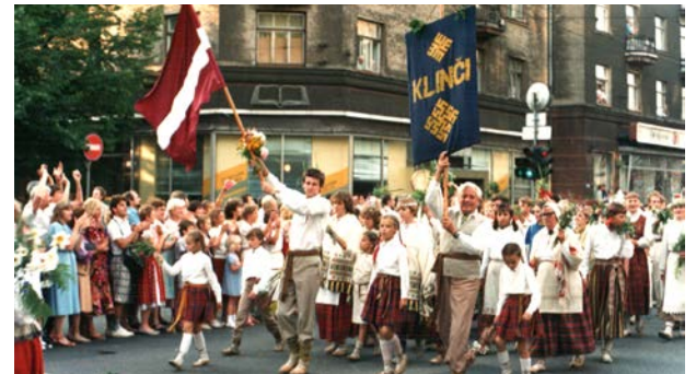
Jēkabpils folkloras kopa „Klinči” folkloras festivāla „Baltica 88” laikā. 1988. gada 10.–17. jūlijs