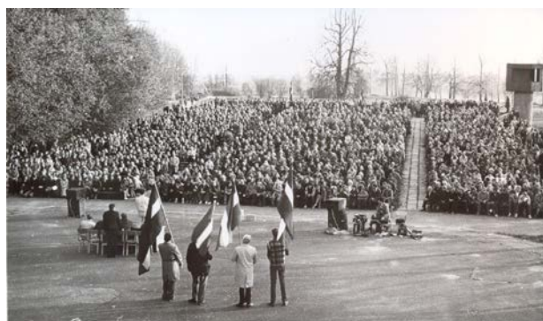
Mitiņš „Pret migrāciju” Komjaunatnes (tagad Krustpils) salīnā 1988. gada 15. oktobrī