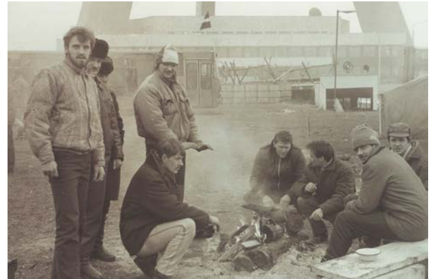
Jēkabpīlieši barikādēs pie Zaķusalas TV torņa 1991. gada 17. janvārī.