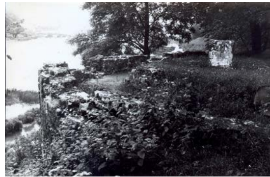
Pieminekļa „Kritušiem par Tēviju 1918 – 1920” pamati. 20. gs. 80. gadu beigās

1992. gada sākumā uzsāka pieminekļa atjaunošanas darbus. Atjaunošanas darbus veica pārvietojamās mehanizētās kolonas amatnieki. Pieminekļa autora, arhitekta A. Birzenieka sākotnējais pieminekļa projekts netika atrasts, tāpēc atjaunošanas darbi tika veikti pēc senajām fotogrāfijām un uzmērot dabā palikušos pamatus. Cēsu komunālo uzņēmumu kombinātā tika izgatavoti vajadzīgā lieluma un formas granīta