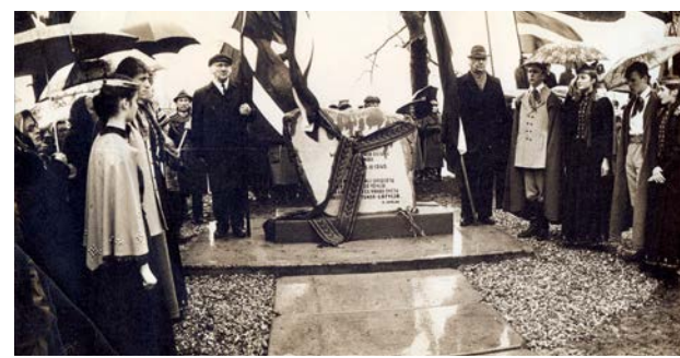
Piemiņas vietas atklāšana komunistiskā genocīda un represijas cietušajiem iedzīvotājiem Jēkabpili pie Krustpils ev. luteriskās baznīcas 1989. gada 25. martā

V. Stukuls. „Krustpīliešu stāstījums”. Izdevējs Madonas tipogrāfija. 1992. gads.