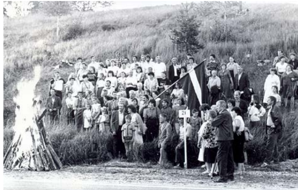
Jēkabpīlieši Latvijas Tautas frontes akcijā „Liesmojošais Baltijas ceļš”. 1991. gada 23. augusts