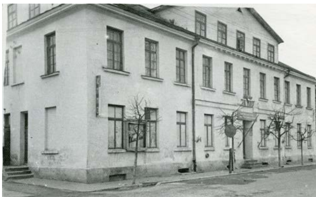
Kinoteātris „Par mieru” Rīgas ielā 111