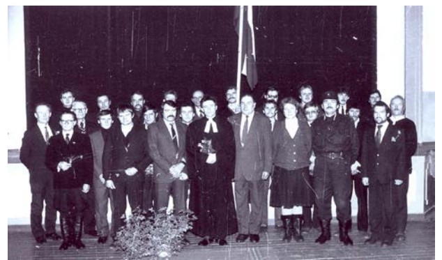
Zemessardzes 56. Kājnieku bataljona vadība, zemessargi un rajona un pilsētas pašvaldību pārstāvji pēc zemessargu zvēresta nodošanas ceremonijas 1991. gada 24. novembrī