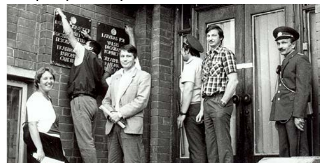
1991. gada 24. augustā vietējās pašvaldības pārstāvji milicijas pavadībā ierodas Valsts Drošības komitejas Jēkabpils nodaļas operatīvajā štābā. Pie nodaļas ārdurvim tiek noņemta izkārtne