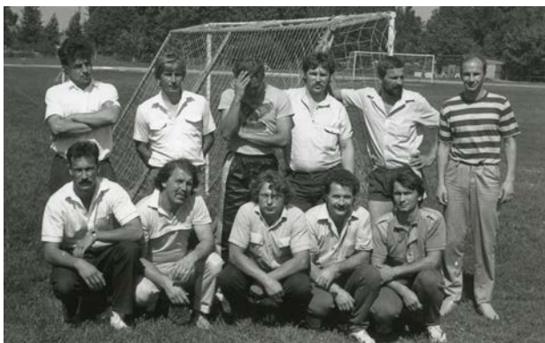
Jēkabpils pilsētas futbola komanda 1990. gadā