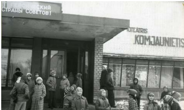
Kinoteātris „Komjaunietis” Jēkabpilī, Gagarina ielā (tagadējā Viestura iela)