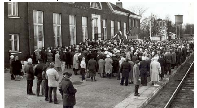
1990. gada 25. martā pie Krustpils dzelzceļa stacijas ēkas atklāj piemiņas zīmi deportētajiem uz Sibīriju