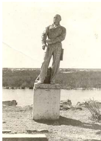
Skulptūra, kas atradās uz pieminekļa „Kritušiem par Tēviju 1918–1920” pamatiem