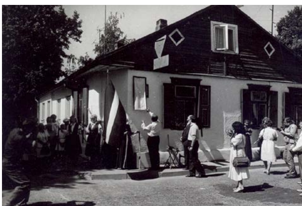
Plāksnes atklāšana Jēkaba ielā, atgūstot vēsturisko ielas nosaukumu 1989. gada 8. jūlijā