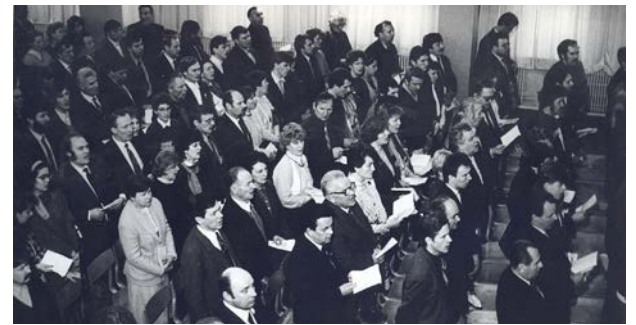
Latvijas Tautas Frontes Jēkabpils rajona nodaļas dibināšanas 1. konference 1988. gada 12. novembrī Jēkabpils Oškālna kultūras namā (tagadējais Tautas nams)