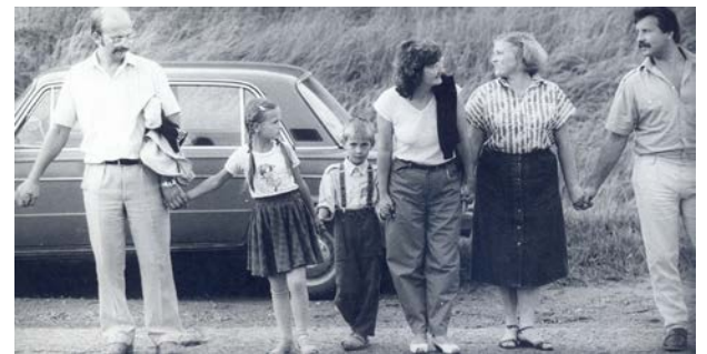
Jēkabpīlieši „Baltijas ceļa” dalībnieki, 1989. gada 23. augustā Rīgas–Pleskavas šosejas 57. kilometrā Cēsu rajonā