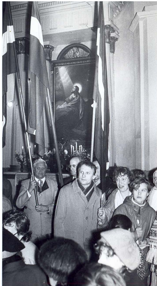
1988. gada 18. novembra dievkalpojums Jēkabpils Sv. Miķeļa baznīcā