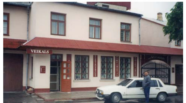
Veikals „Atvars” Vecpilsētas laukumā 1997. gadā