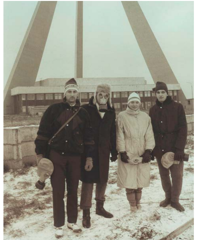
Jēkabpīlieši barikādēs pie Zaķusalas TV torņa 1991. gadā.