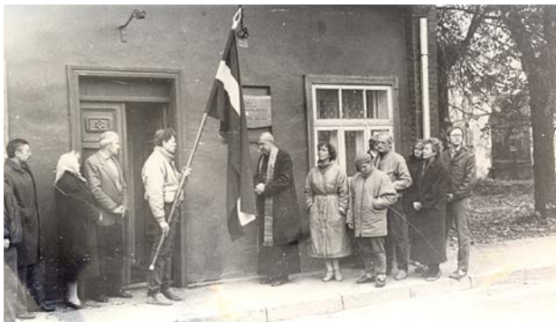
Latvijas Tautas frontes Jēkabpils nodaļas ēka, Brīvības ielā 165