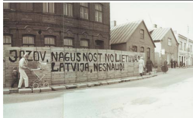
Padomju iela (tagadējā Pasta). 1990. gada marts.