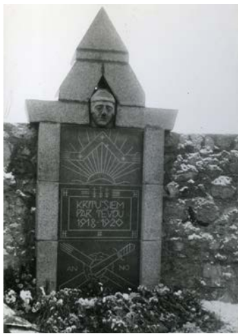
Atjaunotais piemineklis „Kritušiem par Tēviju 1918–1920” pēc atklāšanas 1992. gadā