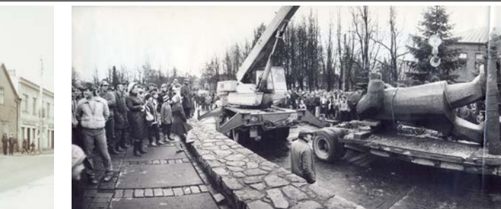
Leņina pieminekļa demontāža laukumā pie Jēkabpils 1. vidusskolas (tagadējās Jēkabpils Valsts ģimnāzijas) 1990. gada 27. novembrī