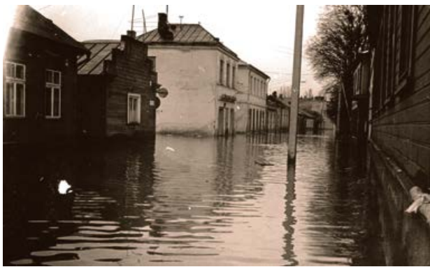
Brīvības iela 1981. gada plūdu laikā