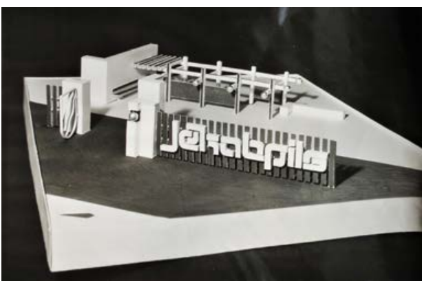
Jēkabpils pilsētas uzraksta konkursa projekts, autors I. Savina. 1980. gads