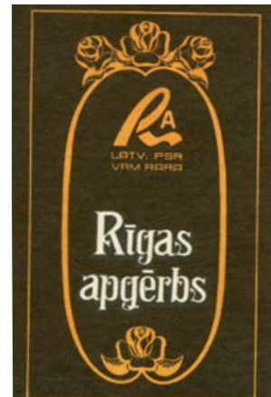
Ražošanas apvienības „Rīgas apģērbs” firmas zīme