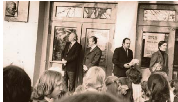
Piemīņas plāksnes atklāšana režisoram V. Segļiņam pie Oškalna kultūras nama (tagad Tautas nams). 1982. gada 30. novembrī