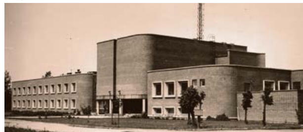
Mežrūpniecības saimniecības administratīvā ēka. 1984. gads.