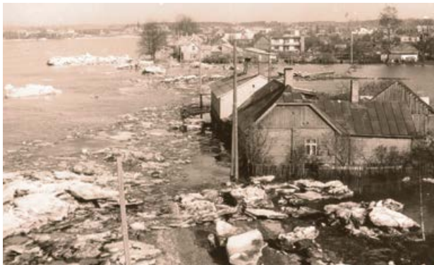
Pļaviņu iela 1981. gada plūdus