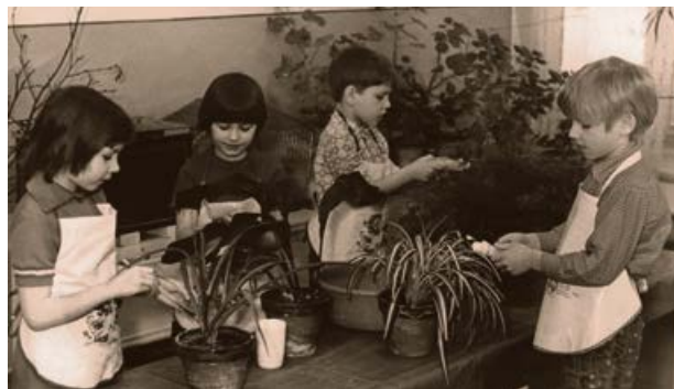
Bērnu dārza „Zvaigzīte” audzēkņi. 1981. gads

Augstais ūdens līmenis pieturējās visu ziemu. Pavasarīgs siltums iestājās marta trešajā dekādē. 25. martā ledus iešana sākās Piedrujas – Daugavpils posmā un 26. martā izveidojās pirmais sastrēgums pie Glaudānu salām, kas paaugstināja ūdens līmeni par 3 m. Pēc tam ledus kustība notika 30. martā pie Nīcgales un augšpus Jēkabpils, bet jau 31. martā ledus iešana sākās visā 60 km garajā posmā no Glaudānu salām līdz Jēkabpilij. Vižņu sablīvējumam pie Sakas salas pienāca ūdens un ledus masu vilnis, izveidojot milzīgu sastrēgumu pie Sakas salas augšdaļas. 31. martā plkst. 23 ūdens līmenis pie Jēkabpils sasniedza atzīmi 83,52 m virs jūras līmeņa, kas par 91 cm pārsniedz līdz tam vēsturisko 1931. gada maksimumu