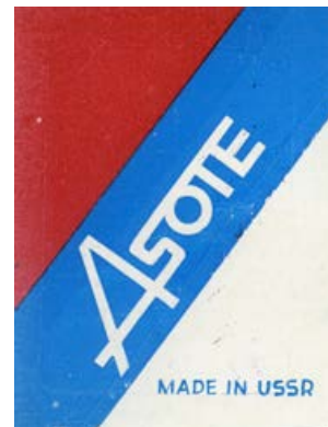
Šūšanas fabrikas „Asote” firmas zīme