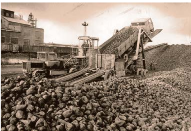
Cukurbiešu izkraušana Jēkabpils cukurfabrikā. 1986. gads