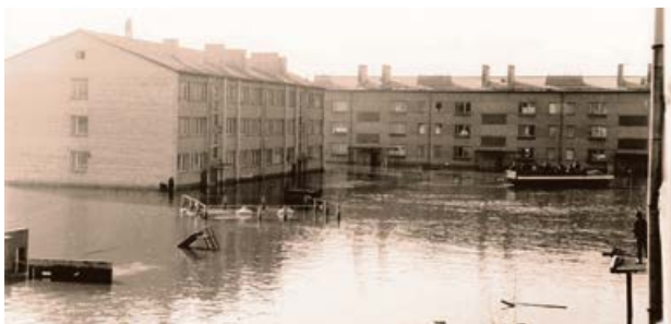
Celtnieku ielas rajons 1981. gada plūdus