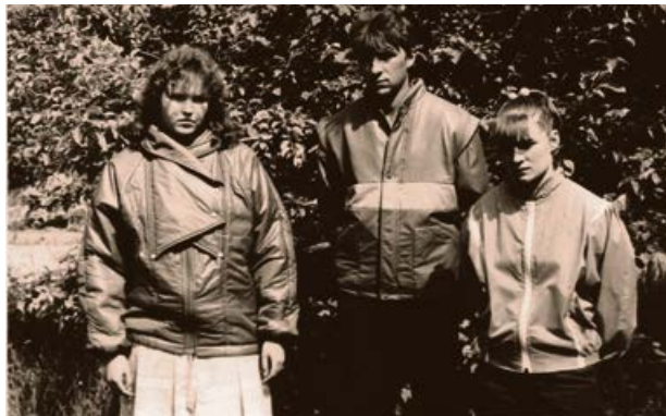
Šūšanas fabrikas „Asote” strādnieki demonstrē vējjaku modeļus. 1987. gads