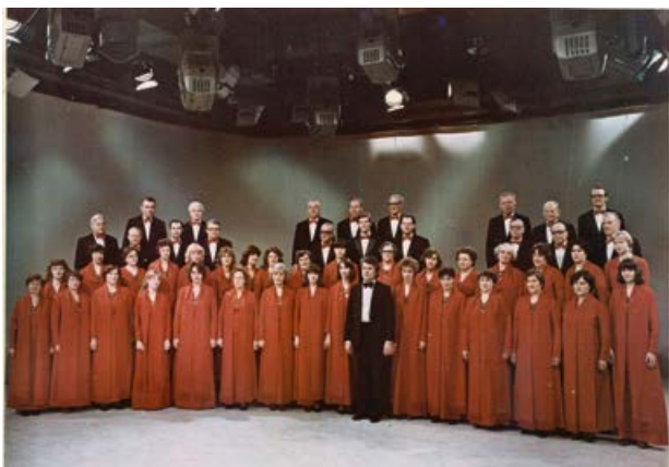
Jēkabpils Skolotāju koris televīzijā. 1985. gads