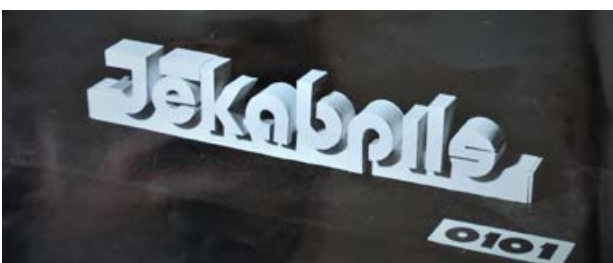
Jēkabpils pilsētas uzraksta konkursa projekts, autors R. Lipora. 1980. gads