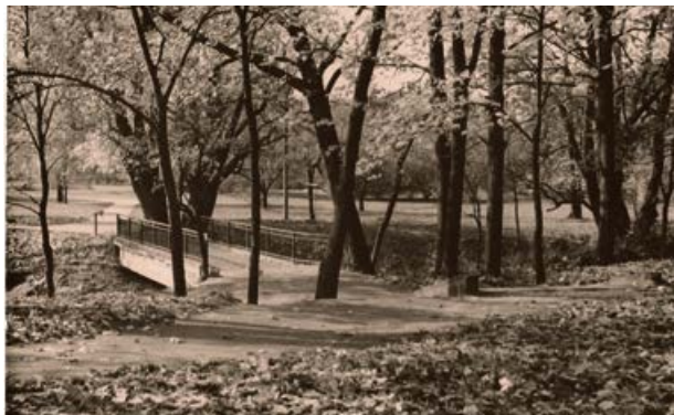
Atpūtas un kultūras parks (Kena parks) 20. gs. 80. gadi

Bet kā labākais paraugs pilsētā ir Jēkabpils mežrūpniecības saimniecības centra teritorijas zāliens, kas labi kopts, netrūkst puķu stādījumu. Labs paraugs – 14. remonta un būvniecības pārvalde, Lauktechnika, veterinārā laboratorija, sviesta un siera bāze, sociālā apdrošināšana.