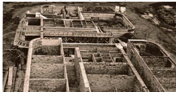
Mežrūpniecības saimniecības administratīvās ēkas celtniecība.