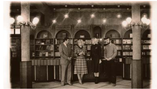
Grāmatnīcas „Aisma” atklāšana 1987. gadā