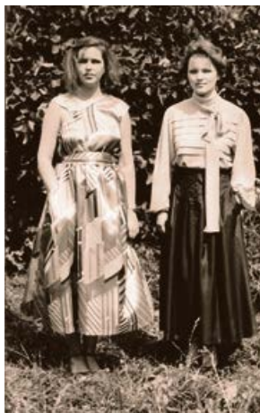
R/a „Rīgas apģērbs” Jēkabpils filiāles darbinieces demonstrē jaunāko apģērbu modeļus. 1987. gads