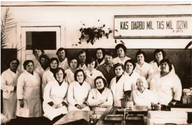
Jēkabpils Autoelektro piederumu rūpnīcas strādnieki. 20. gs. 80. gadu vidus