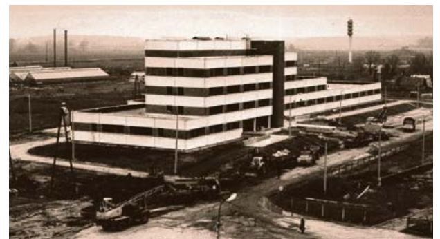
Poliklīnikas celtniecība. 20. gs. 80. gadu sākums