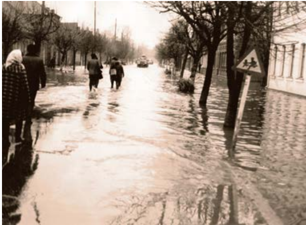
Rīgas iela 1981. gada plūdu laikā