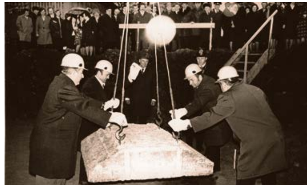
Mežrūpniecības saimniecības administratīvās ēkas pamatakmens iemūrēšana 1979. gadā.