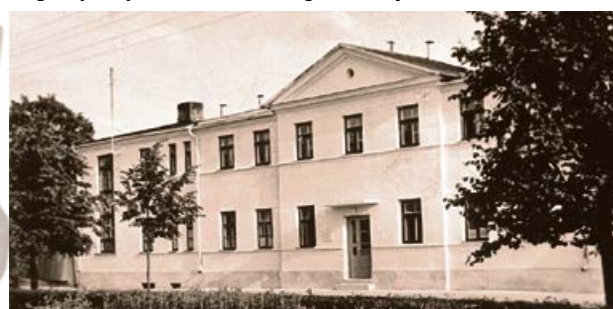
Jēkabpils prettuberkulozes dispansera ēka.