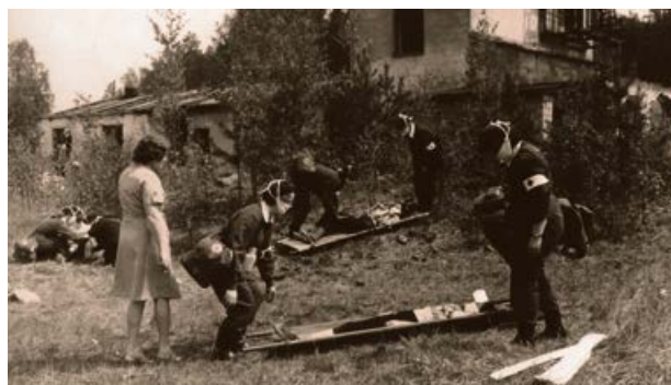
Sanitāro kopu sacensības 1981. gadā Jēkabpilī