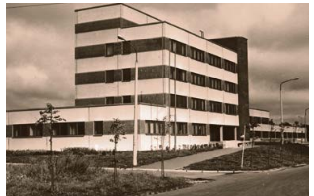
Jaunā poliklīnikas ēka