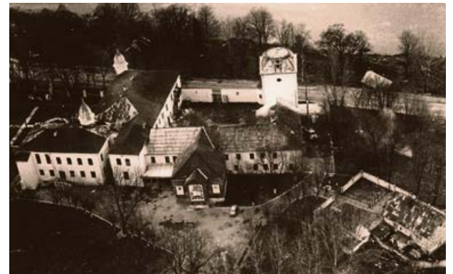
Krustpils pils 20. gs. 80. gadu beigās