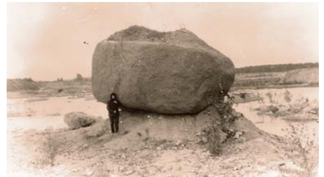
1987. gadā pēc dolomīta karjera applūšanas izveidojas vēlākā Radžu ūdenskrātuve, kur atrodas dižakmens