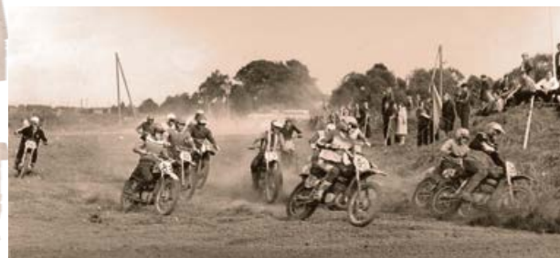
Starprepublikāniskais draudzības motokross, veltīts Jēkabpils motosporta 20. gadu jubilejai Pelītes trasē 1979. gada 23. septembrī