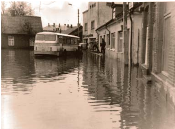
Vecpilsētas laukums 1981. gada plūdus