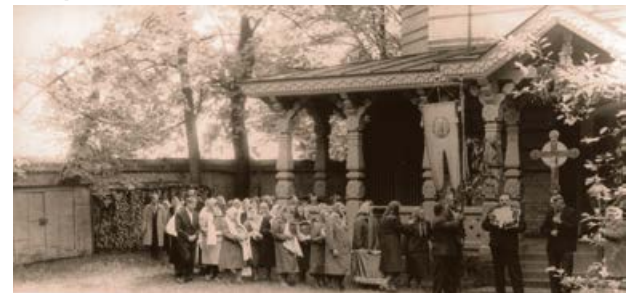
Sv. Gara pareizticīgo dievnama 100 gades svinības 1987. gadā