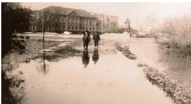
Laukums pie Jēkabpils 1. vidusskolas (Jēkabpils Valsts ģimnāzijas) 1981. gada plūdus