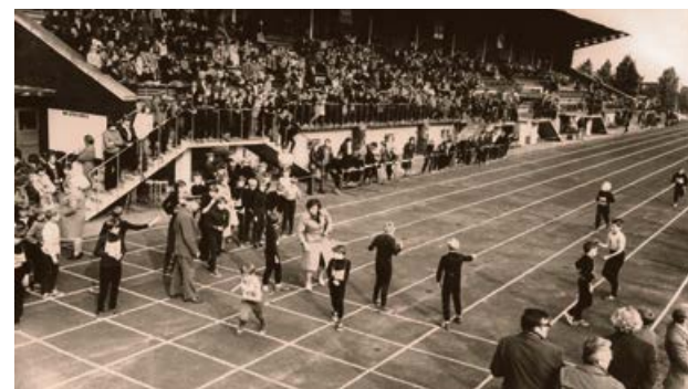
Vissavienības skrējēju diena Jēkabpilī sporta biedrības „Vārpa” stadionā 1982. gada 12. septembrī