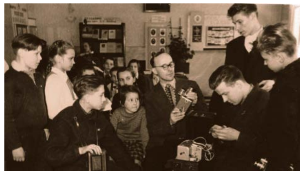
Attēls no filmas „Pirmie kadri” Krustpils Pionieru namā. 1961. gada marts