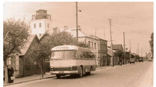
Rīgas iela. 1965. gads