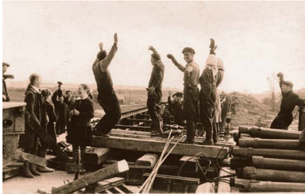
Jēkabpils – Krustpils Daugavas tilta celtniecība. Skats, kad Krustpils krasts savienojas ar Jēkabpils krastu. 1962. gads.

Tilta būvdarbi bija nedaudz ieilguši. Metālisko konstrukciju detaļas jau izgatavotas. Celtnieki apsoliya, ka līdz novembra mēnesim pāri tiltam varēs iet gājēji, bet ar decembra mēnesi kursēs arī autotransports. Celtniekiem