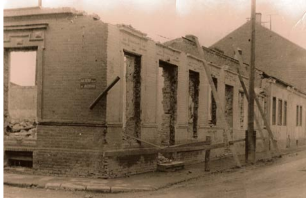
Jēkabpils piena kombināta rekonstrukcija. 1965. gads

Laikrakstā „Brīvā Daugava” 1966. gada 31. marta numurā publicēts raksts par nekārtībām pilsētā. „Par lielu un strauji augošu rūpniecības centru kļūst Jēkabpils. „Jēkabpīlieši lepojas ar uzceltām rūpniecībām”. Kādreizējā provinces amatnieku un tirgotāju mazpilsēta kļūst par ražošanas centru un pilsētas produkciju pazīst tālu aiz robežām. Līdz ar pilsētu aug arī iedzīvotāju prasības. Ik gadus atvēlē līdzekļus pilsētas labiekārtošanai un apzaļumošanai. Nepieciešama visu jēkabpīliešu aktīva līdzdalība pilsētas labiekārtošanas darbos un zaļas rotas saglabāšanā. Atbildība gulstas uz komunālā uzņēmuma tresta kolektīvu. Bieži novērojama prakse, ka sētņieku savāktos atkritumus, saslaukas neaizved. 1966. gadā Jēkabpils pilsēta esot tikusi nosaukta kā viena no netirākajām pilsētām republikā. Skan acinājums, ka jēkabpīliešiem no šī kaunpilnā stāvokļa jāizkļūst. Ir līdzekļi, tehnika, cilvēku resursi, bet trūkst pareizas organizācijas. Pienācis laiks pilsētu apzaļumot pēc vienota plāna”