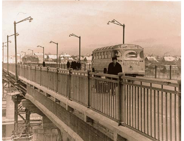
Tilts pār Daugavu. 20. gs. 60. gadi.

Tilts gājējiem bija pieejams jau 1962. gada 7. novembrī, bet decembra mēnesī arī autotransportam.