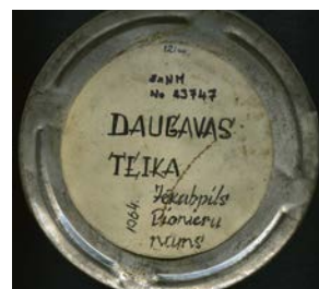
Jēkabpils Pionieru nama un Jēkabpils 3. vidusskolas Kino – foto pulciņa uzpemtā filma „Daugavas teika”. Autori: J. Bērziņš, V. Rudzītis, A. Savickis