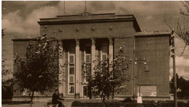
Krustpils kultūras nams. 20. gs. 60. gadi