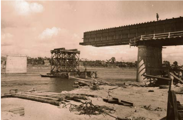
Tilta celtniecības darbi 1961. gada augustā