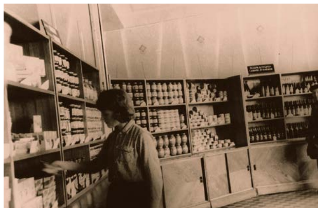
Jēkabpils Patērētāju biedrības pašapkalpošanās veikals Nr. 19. 20. gs. 60. gadi