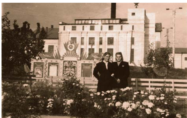
Jēkabpils cukurfabrika. 20. gs. 60. gadu otrā puse