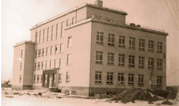
Krustpils 1. vidusskolas (tagadējās Jēkabpils 3. vidusskolas) celtniecība