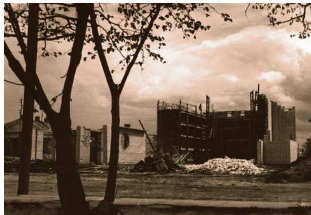
Kinoteātra „Komjaunietis” celtniecība. 20. gs. 60. gadi