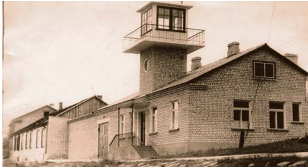
Jēkabpils pilsētas glābšanas stacija. 1961. gads