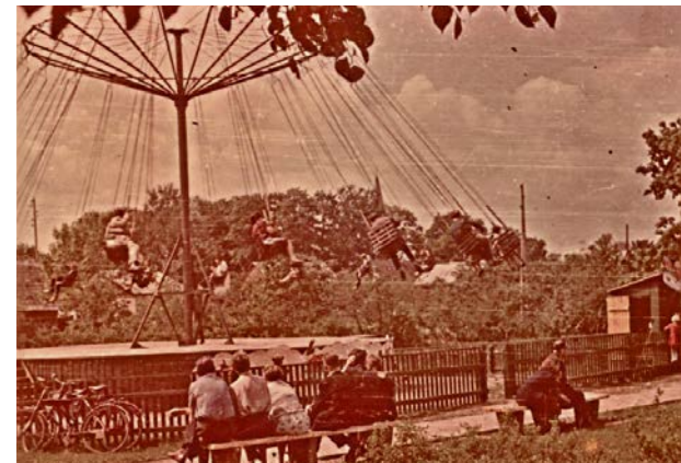
Kultūras un atpūtas parks (Kena parks) 20. gs. 60. gadi.