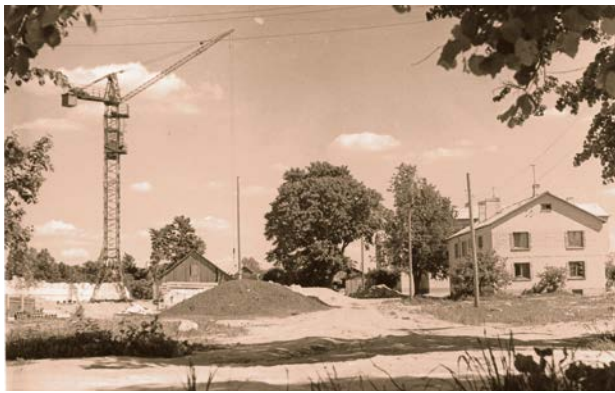
Draudzības alejas apbūve Jēkabpilī. Ap 1965. gadu