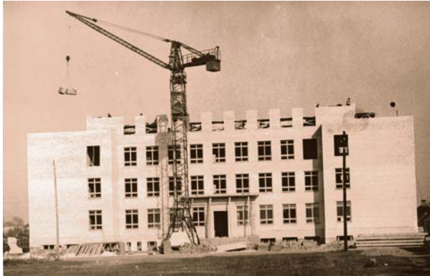
Jēkabpils 2. vidusskolas celtniecība. 20. gs. 60. gadi