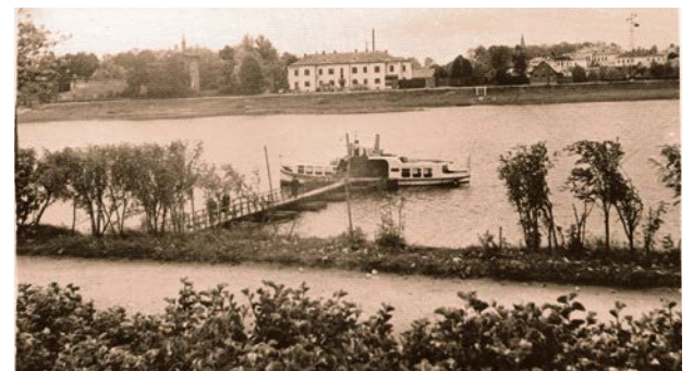
Kūģis „Gulbis”, kas veica pārvadājumus pār Daugavu 20. gs. 60. gadi