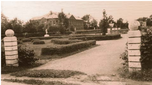
Laukums pie Jēkabpils 1. vidusskolas (Jēkabpils Valsts ģimnāzija) 20. gs. 60. gadi