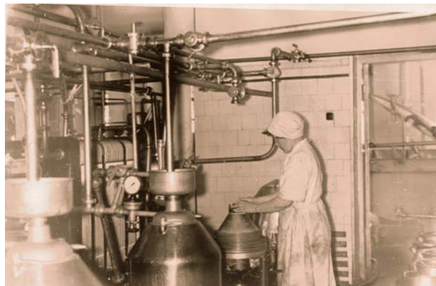
Separāta aparāts Jēkabpils piena kombinātā. 20. gs. 60. gadi