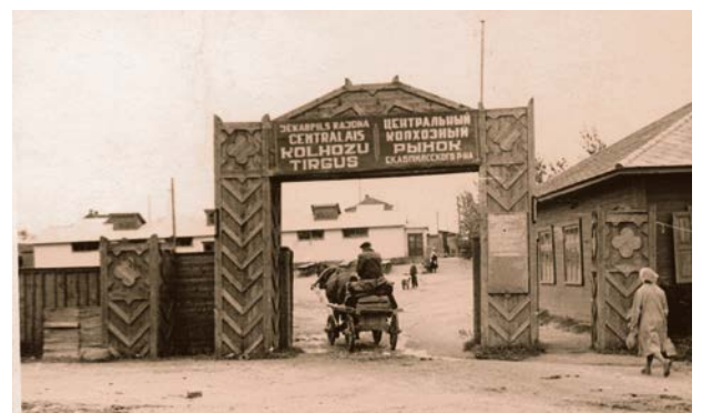
Jēkabpils rajona centrālais kolhoza tirgus. 20. gs. 60. gadi