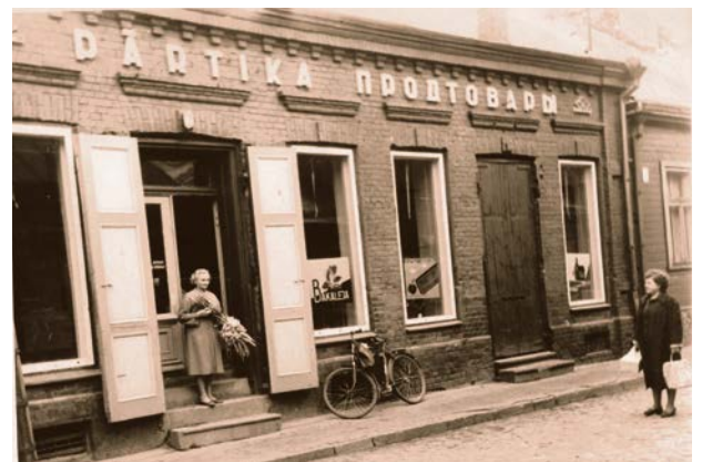
Jēkabpils Patērētāju biedrības pārtikas veikals Nr. 6 Jēkabpilī. 20. gs. 60. gadi.