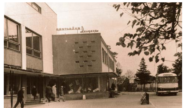
Universālveikals Jēkabpilī ar kafējnicu un restorānu „Daugava” 1965. gads