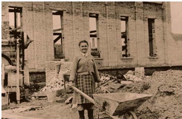
Krustpils kultūras nama celtniecība

1967.gadā Jēkabpilī uz katriem 1000 iedzīvotājiem tiek piegādāti 1248 preses izdevumi.