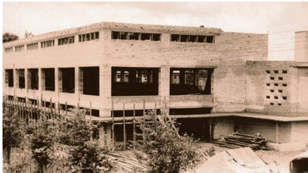
Universālveikala celtniecība. 20. gs. 60. gadi