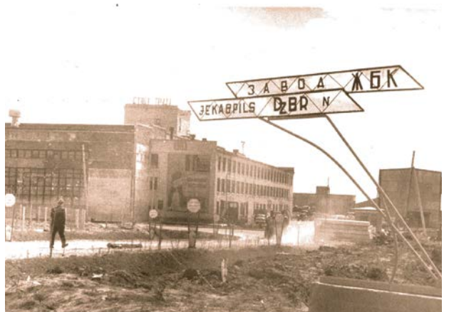
Jēkabpils saliekamo dzelzbetona konstrukciju rūpnīca

Šūšanas fabriku „Asote” nodibina 1967. gada septembrī bijušās slimnīcas telpās. Fabrikas izveidi atbalstīja Latvijas PSR Rūpniecības ministrija. 1968. gadā mācīties uz Rīgu, šūšanas uzņēmumu „Latvija”, tika nosūtītas 64 strādnieces. Šūšanas fabrika „Asote” 1969. gadā sāka šūt sporta jakas, mēteļus no ūdens necaurīdīga (neilona) materiāla.