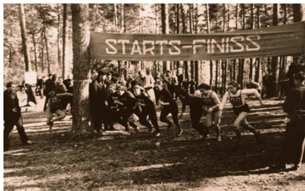
Sacensības Jaunajā mežā. 20. gs 60. gadi