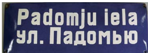
Jēkabpils pilsētas ielu nosaukumu izkārtnes