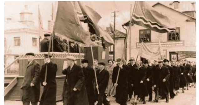
Svētku demonstrācija Jēkabpilī, Komjaunatnes laukumā. 20. gs. 50. gadi