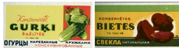
Jēkabpils konservu rūpniecības produkcijas etiķetes. 20. gs. 50. gadi