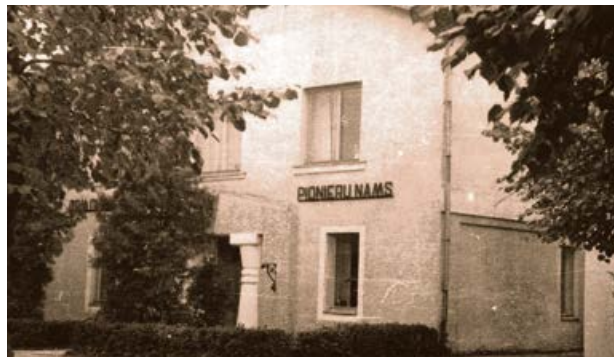
Jēkabpils Pionieru nams. 20. gs. 50. gadi.

1955. gadā Jēkabpils pilsētā arteli „Jaunais ceļš” strādā 33 darbinieki. Izgatavo 2500 pārus apavu gadā.