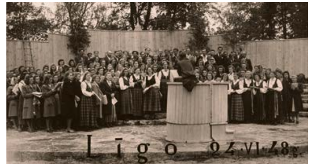
Jēkabpils apriņķa Dziesmu diena. 1948. gada 24. jūnijs