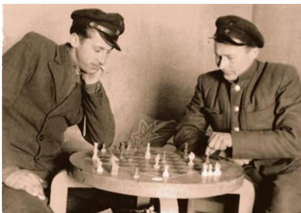
Jēkabpils dzelzceļa stacijas strādnieki. 20. gs. 50. gadi