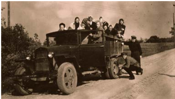
Jēkabpils rajona kultūras nama dramatiskais kolektīvs dodas izrādē uz kolhozu „Sēlija”. 1949. gada maijs