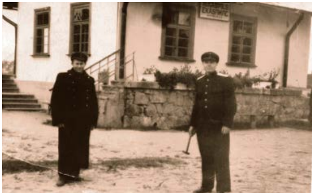
Jēkabpils dzelzceļa stacijas ēka. 20. gs. 50. gadi