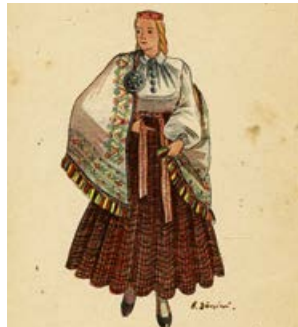
Pastkarte. Krustpils tautas tērps. A. Dārziņas zīmējums. Izdevējs J. Liepiņš, Esslingenā. 20. gs. 40. gadu beigas