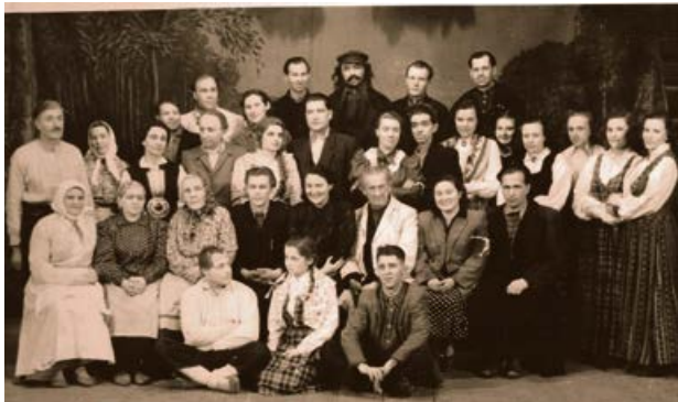
Jēkabpils teātris pēc R.Blaumaņa lugas „Skroderdienas Silmačos” izrādes. 1957. gads