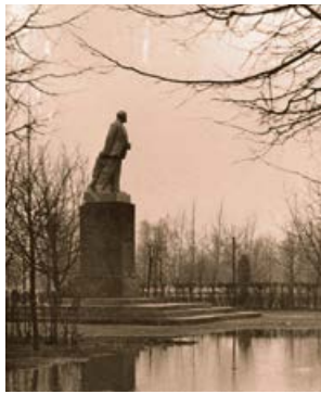
Leņina piemineklis Krustpilī, Padomju armijas parkā. 20. gs. 50. gadi

20. gs. 50. gados Komunālā uzņēmuma kombināta strādnieki noņēma Baptistu draudzes baznīcas krustu un nojauc tornīti.