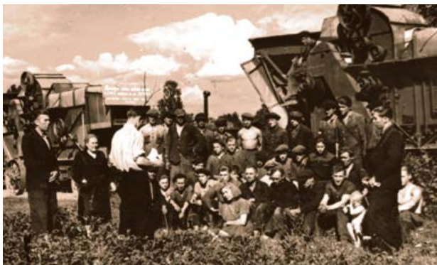
Jēkabpils MTS sociālistisko saistību pieņemšana. 1953. gads