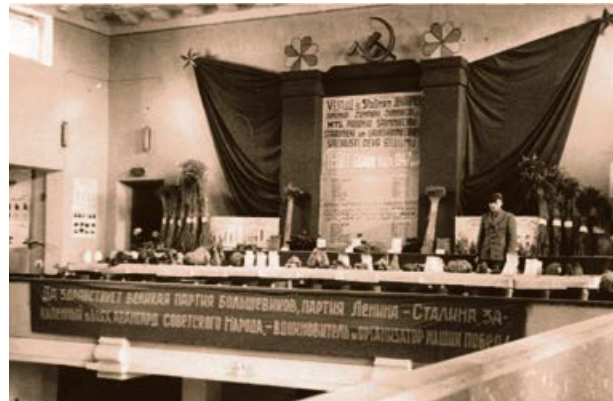
Lauksaimniecības izstāde Jēkabpils kultūras namā. 20. gs. 40. gadu beigas