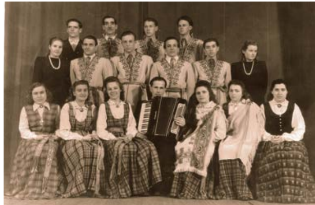
Jēkabpils kultūras nama deju kolektīvs 1952. gada martā