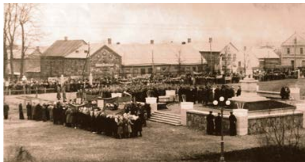
J. Staļina pieminekļa atklāšana Sarkanarmijas laukumā