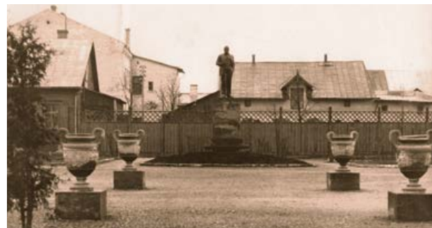
Skvērs ar Leņina pieminekli pie Jēkabpils kultūras nama