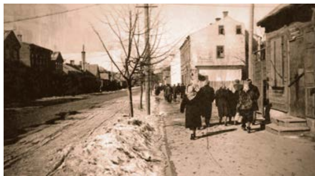
Rīgas iela Krustpili. 20. gs. 50. gadi.