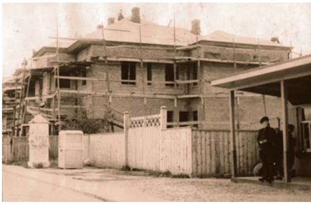
Jēkabpils vilnas vērpšanas jaunceltne. 1954. gads