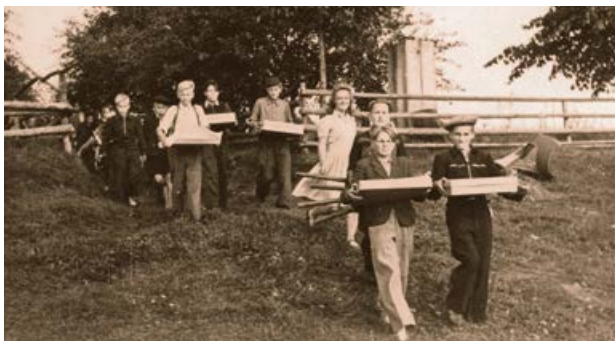
Skolēni arheoloģiskajos izrakumos Asotes pilskalnā. 20. gs. 50. gadi