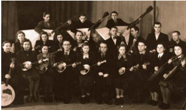
Jēkabpils kultūras nama dombru orķestris. 1950. gads