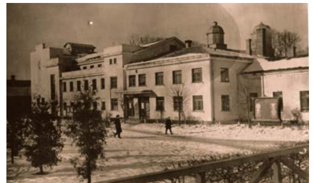
Jēkabpils Kultūras nams. 1954. gads.