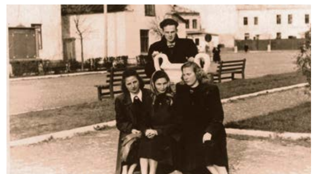
Jēkabpīlieši pie Jēkabpils kultūras nama 1954. gada 15. maijā.