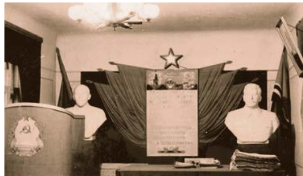
Krustpils cukurfabrikas skatuves noformējums. 20. gs. 40. gadu beigas