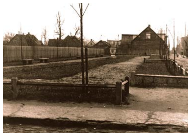
Tagadējās Pasta un Viestura ielas stūra skvērs. 20. gs. 50. gadi

Savukārt 1951. gadā tiek demontēts piemineklis „Kritušiem par Tēviju 1918.–1920.” (atklāts 1925. gadā), kas atradās Rīgas ielā Daugavas krastā pretī Krustpils pilij. Piemineklis, kas liecināja par Latvijas Brīvības cīņām un mūsu karavīru varonību, atbrīvojot Latviju.