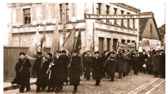
Darbaļaužu demonstrācija Jēkabpilī. 1949. gada 7. oktobris