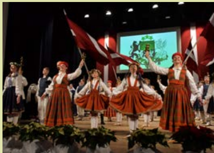
FOTO ATSKATS UZ 18. NOVEMBRA SVĒTKIEM