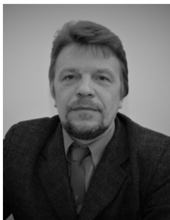
ministrijas Atzinības rakstu.