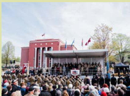
FOTO ATSKATS UZ 4. MAIJA GRANDIOZO NBS PARĀDI