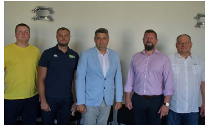
Francijas Kannām un Nanti, Portugāles Lisabonu, Turcijas Ankaru, Šveices Lozannu, Serbijas Belgradu, Čehijas Prāgu. Lai spēks un izturība!

Atgādinām, ka SK „Jēkabpils lūši” 2019./2020. gada Baltijas līgas sezonā izcīnīja Latvijas labākās (1. vieta) komandas nosaukumu un saņēma ielūgumu uz Eiropas kausiem volejbolā – CEV Volleyball Challenge Cup 2021 , tādējādi nostājoties vienā pozīcijā ar tādiem Eiropas pilsētu klubiem kā Itālijas Milānu,