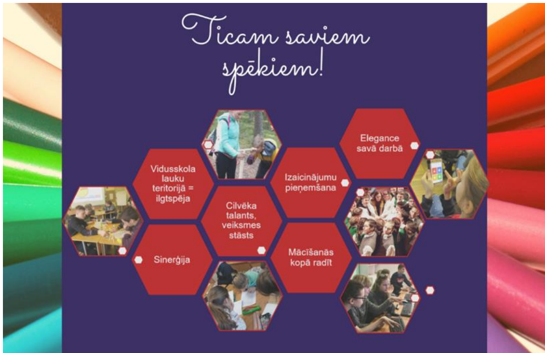
1.attēls. Salas vidusskolas vīzijas atslēgvārdi