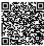
Jēkabpils novada pašvaldības Attīstības pārvalde

Karte – www.jekabpils.lv/lv/jaunums/jekabpils-novada-pasvaldibas-ielu-un-celu-remontdarbu-karte .