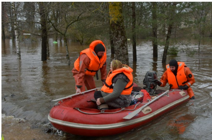
Sabiedrisko attiecību un digitālās komunikācijas nodaļa

tres personā, atbraukt un novērtēt plūdu radītos postījumus Jēkabpils novada pašvaldībā! Liels paldies Civilās aizsardzības komisijai un visiem iesaistītajiem dienestiem – Neatliekamās medicīniskās palīdzības dienestam (NMPD), Valsts policijai, Jēkabpils novada Pašvaldības policijai, AS “Sadales tīkli”, Valsts ugunsdzēsības un glābšanas dienestam (VUGD), gan Jēkabpils, gan arī Pļaviņu daļai, kā arī pašvaldi-