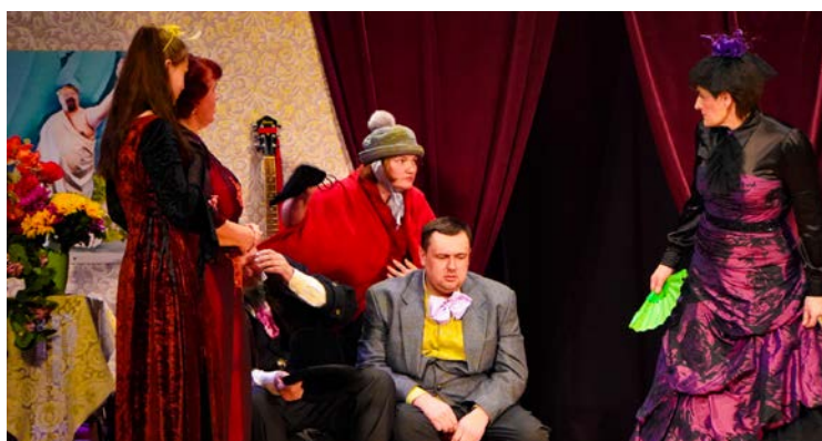
Kalna tautas nama amatierteātris “Vienība”

• Kalna Tautas nama amatierteātris “Vienība” (režisors Gints Audzītis), izrāde “Ak, maigā sirsniņa” (V. Sollogubs) – 1. pakā-