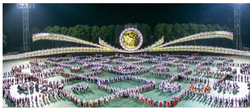
8. jūlijā Latvijas novadu krāsās koši iemirdzējās deju lieluzvedums "Mūžīgais dzinējs".