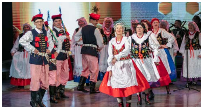
4. jūlija vakarā Mihaila Čehova Rīgas Krievu teātri notika mazākumtautību kolektīvu koncerts "Saules dziesmu audeklā", kurā kopā ar citiem dalībniekiem piedalījās trīs Jēkabpils novada kolektīvi. Bildē Jēkabpils poļu biedrības "Rodacy" folkloras kopa "Zgoda" un deju kopa "Rosa".