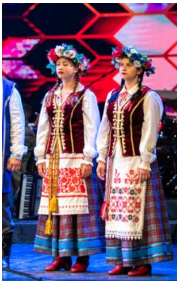
Krāšņiem tērpiem koncertā piedalījās arī Jēkabpils baltkrievu biedrības "Spatkanne" ansamblis "Zaviruha".