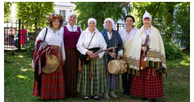
Krustpils kultūras centra sēļu tradicionālās mūzikas grupa "Krāce" pēc uzstāšanās Vērmanes dārzā Sēļu stundā.