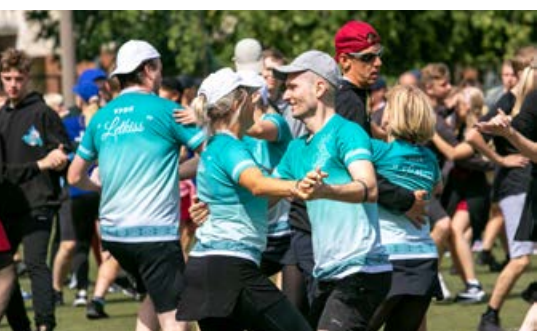
Deju lieluzveduma "Mūžīgais dzinējs" mēģinājumā VPDK "Letkiss" dejotāji.