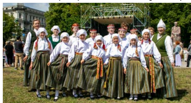
Deju solī kopā ar citām folkloras kopām vienotās Dignājas pamatskolas Folkloras kopa "Dignōjiši", kas uzstājās Esplanādē.