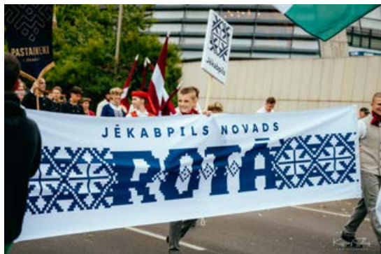
Dalībnieku svētku gājiens "Novadu dižošanās". Šajos svētkos Jēkabpils novads tika pārstāvēts divos vēsturiskajos novados. Sēlijas novads, prezentējot novada raksturojošo kultūrzīmi "Vilkapēdu".