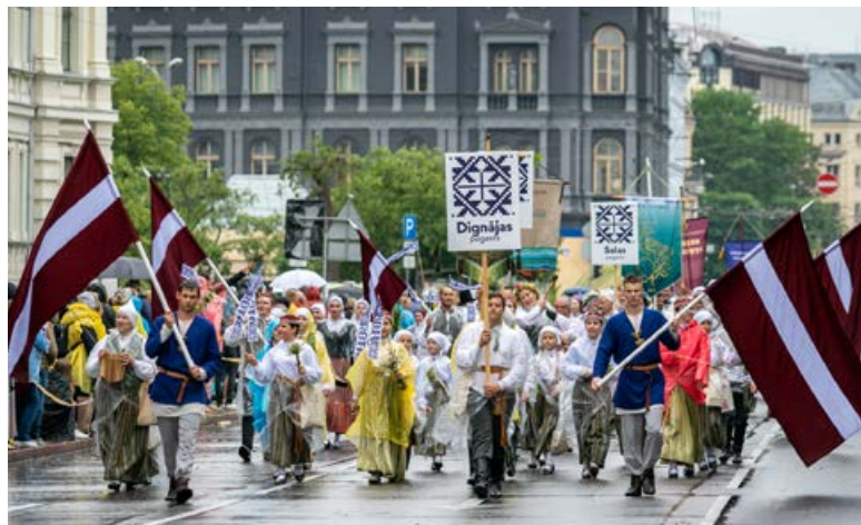
Spītējot lietum, Jēkabpils novads ROTĀJĀS svētku gājiēnā 2. jūlijā.