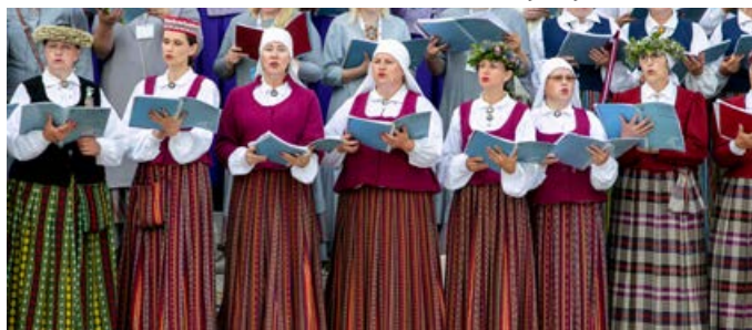
Krustpils kultūras centra jauktā kora "Noskaņa" dalībnieces.