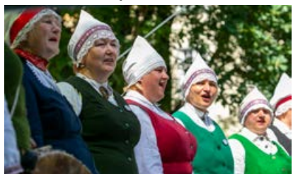
Vērmanes dārzā Sēļu stundu izdziedāja un izspēlēja Krustpils kultūras centra folkloras kopa "Rati".