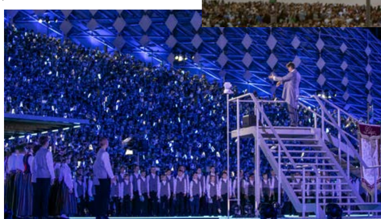
Kopā būt! Kopā just! Mežaparka lielā estrādē jeb "Sīdriba birzs" iemirdzējās tūkstošiem gaismiņu.