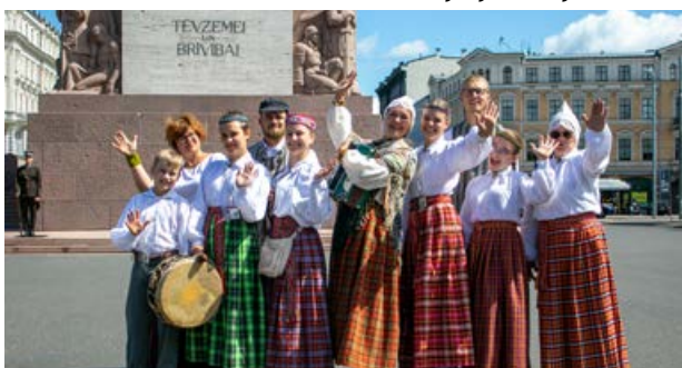
Folkloras diena "TĪRA SPĒLE. GODS. GODI. GODĪGUMS", kurā piedalījās Jēkabpils novada folkloras kopas. Vīpes tautas nama Bērnu un jauniešu folkloras kopa "Lākači", kuri sadziedājās pie Brīvības pieminekļa, kā arī kāpa uz Vērmanes dārza skatuves.