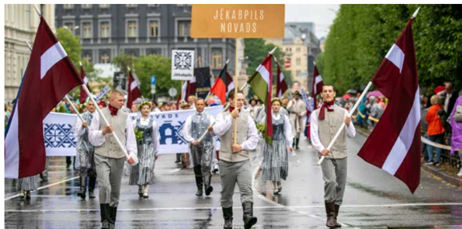
Jēkabpils novadu svētkos pārstāvēja 990 dalībnieki no 42 kolektīviem.