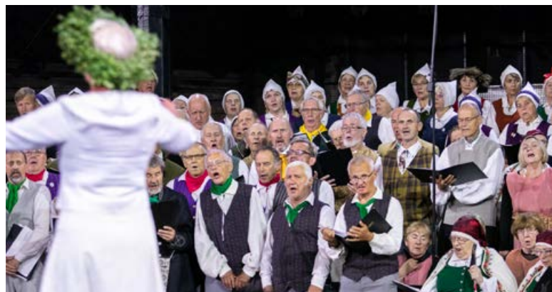
Rīgas Cirkā brīnišķīgā svētku atmosfērā noritēja koncerts "Klusums reiz par tautu tapa", dalībnieku vidū – arī Krustpils kultūras centra senioru jauktais koris "Atvasara".