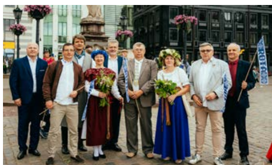
Svētku gājiēnā kopā ar dalībniekiem gāja Jēkabpils novada administrācija.