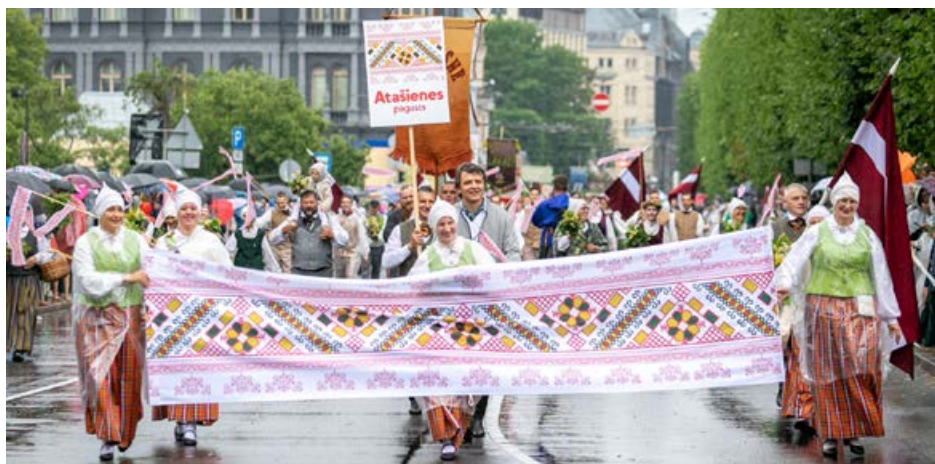
2. jūlija dalībnieku svētku gājiens "Novadu dižošanās". Latgales novads, prezentējot novada raksturojošo kultūrzīmi "Krustpils villaini".