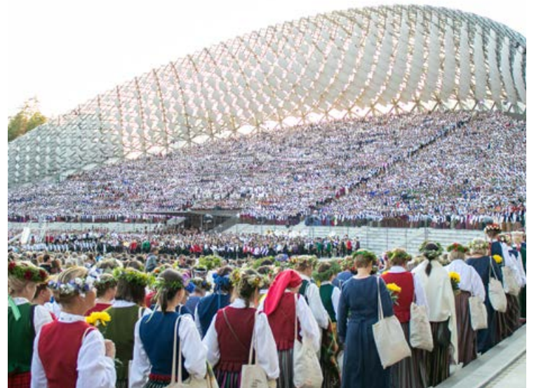
9. jūlijā Mežaparka Sīdriba birzī izskanēja Dziesmusvētku tradīcijas 150. gadadienai un mūsu visu kopīgajai un gaišajai rītdienai veltītais koncerts "Kopā augšup". Pasākumā piedalījās Jēkabpils novada kori, Jēkabpils Tautas nama pūtēju orķestris.