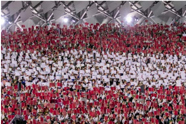
Vienoti dziesmā koncertā piedalījās arī mūsu Jēkabpils novada koru kolektīvi: Zasas Tautas nama jauktais koris "Putni", Jēkabpils Tautas nama sieviešu koris "Unda", Krustpils kultūras centra jauktais koris "Noskaņa", Sēlpils Tautas nama jauktais koris "Sēlpils" un Viesītes kultūras centra "Sēlija" jauktais koris "Viesīte".