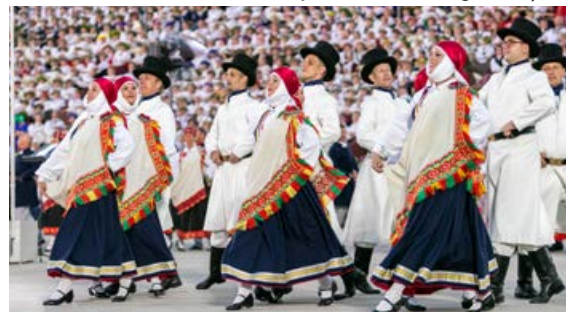
"Kopā augšup" koncertā piedalījās arī Krustpils kultūras centra vidējās paaudzes deju kolektīvs "Kreicburga".