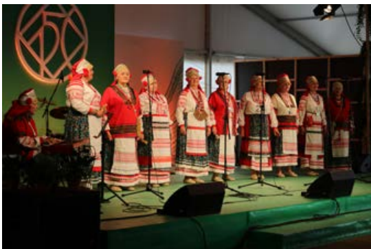
6. jūlijā Esplanādē un Vērmanes dārzā norisinājās Tautu diena "Raduma Spēks" visas dienas garumā. Piedalījās arī Jēkabpils novada mazākumtautību kolektīvi ar krāšņiem tērpiem, skanīgām dziesmām un izceļot savas tautas tradīcijas elementus.