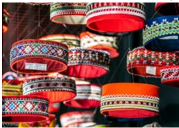
Līdz 30. jūlijam ir iespēja apskatīt plašu un krāšņu tautas lietišķās mākslas izstādi "Mēs" Rīgā, Sporta ielā 2, kurā izstādīti arī Jēkabpils novada iedzīvotāju darbi. Izstādē apskatāmi Vīpes amatniecības centra "Māzers" un Krustpils kultūras centra tautas lietišķās mākslas studijas "Saulgrieži" darbi.