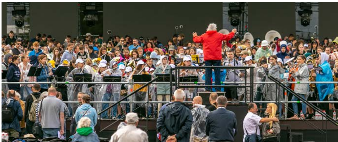
Jēkabpils novada pūtēju orķestri – Krustpils kultūras centra pūtēju orķestris "Krustpils" un Jēkabpils Tautas nama pūtēju orķestris – piedalījās koncerta "Laiks iet pāri" mēģinājumā "Wondersalā" un uzstājās koncertā 5. jūlijā.