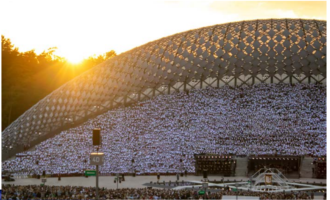
6. jūlija vakarā 454 kori un gandrīz 16 000 dalībnieku vienotās emocionālā un krāšņā koncertā "Tīrums. Dziesmas ceļš".