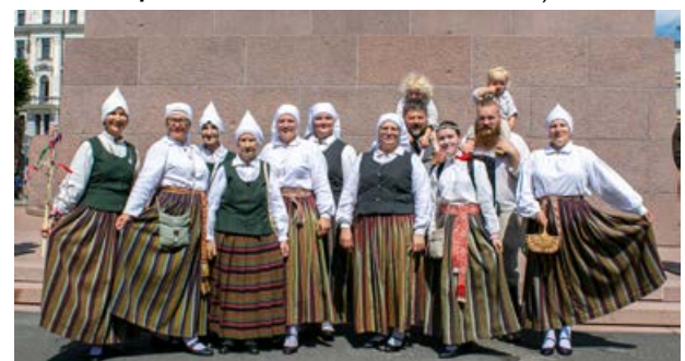
Brīvības laukumu pieskandināja Atašienes folkloras kopa "Viraksne".