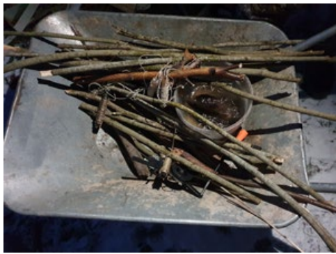
Atsevišķos gadījumos rīku daudzums ir tik liels, ka nav ar rokām nesams

Iedzīvotājus aicinām nebūt vienaldzīgiem, redzot pārkāpumus pret apkārtējo vidi, un ziņot pa tālruni +371 20288065.