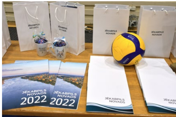
Sabiedrisko attiecību un digitālās komunikācijas nodaļa

Dome nolēma piešķirt Pateicības rakstus un naudas balvas Jēkabpils sporta centra un Jēkabpils sporta skolas sportistiem un treneriem par izcilēm sasniegumiem sportā. Kopumā tika apbalvoti 16 Jēkabpils Sporta skolas – orientēšanās, šaha, vieglatlētikas, akvatlona, kanikrosa/biatlona sporta veidu – sportisti un pieci treneri, kā arī 93 Jēkabpils sporta centra – volejbola, telpu futbola, vieglatlētikas, orientēšanās, kanikrosa/biatlona, pauerlīftinga, svāra bumbas, rokas bumbas, galda tenisa – sportisti un 8 treneri. Naudas balvu apmaksā veikta no Jēkabpils novada pašvaldības budžeta līdzekļiem par kopējo summu 17 872,50 eiro.