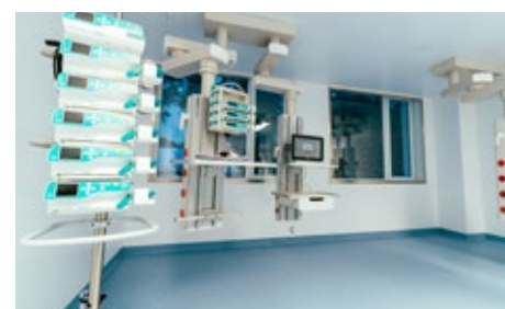
Jēkabpils reģionālās slimnīcas reanimācija šobrīd ir viena no modernākajām valstī