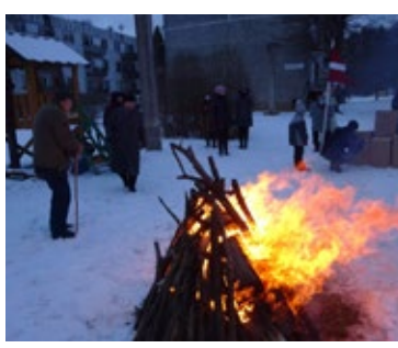
kurs, vēstot par atmiņām.