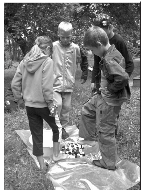
Sporta pēcpusdienas laikā