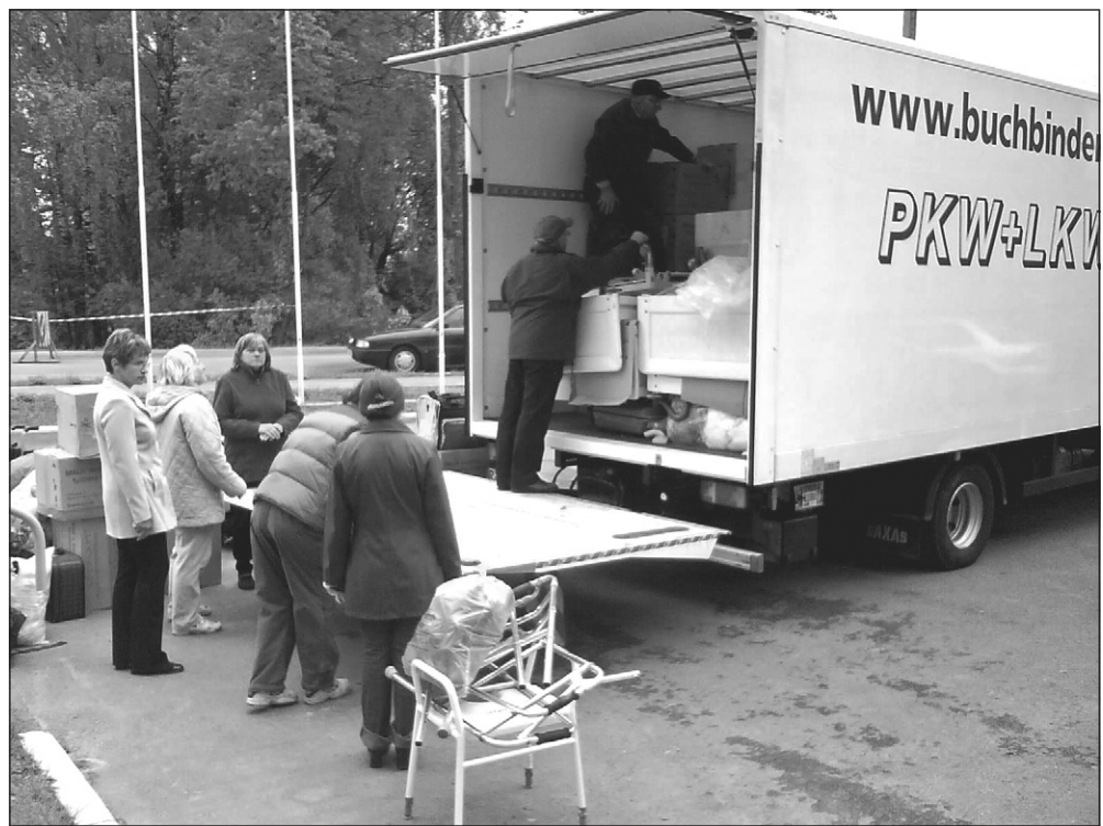
Ziedojumu sūtījums no sadraudzības pilsētas Melles Vācijā

ālās pārvaldes mērķauditorija, uzsākot patstāvīgu dzīvi), apavi, somas, zidaiņu drēbes, rotaļlietas. Lietu saņēmēji ir Sociālās pārvaldes klienti, bet palīdzība netiek atteikta arī jebkuram pensionāram vai trūcīgam cilvēkam. Palīdzību regulāri pēc vajadzības saņem bāreņi, daudz bērnu ģimenes. Ir padomā rīkot labdarības dienu, kad saziedotās lietas