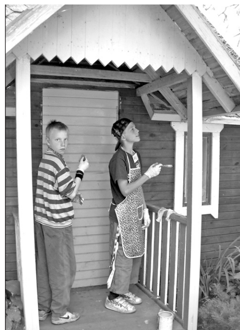
Radošo darbnīcu laikā tiek pārkrāsots āra inventārs