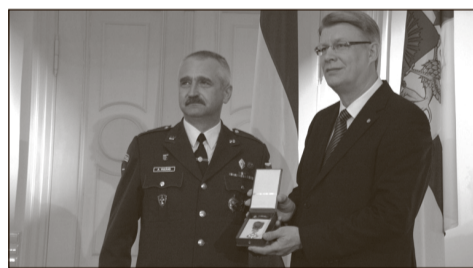
Apbalvojumu no Valsts prezidenta saņem Aivars Vucāns