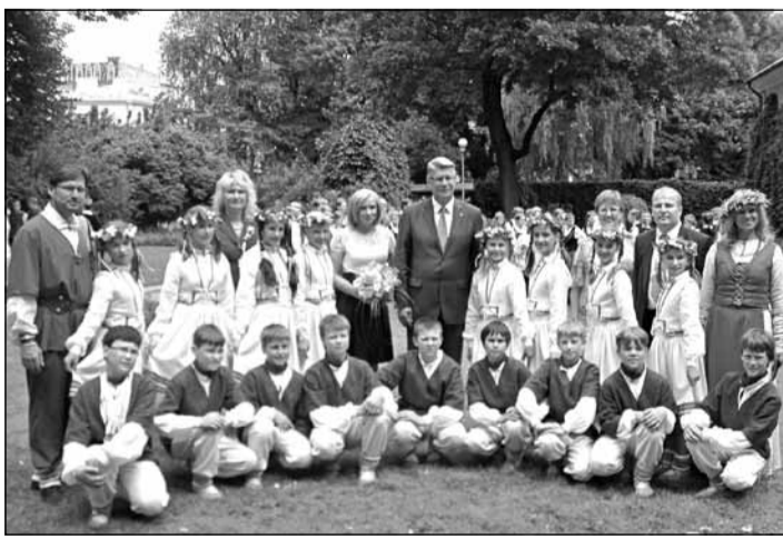
Deju kolektīvs „Pastalnieki” izpelnījās visaugstāko novērtējumu skatē un viesojās pilī pie Valsts prezidenta