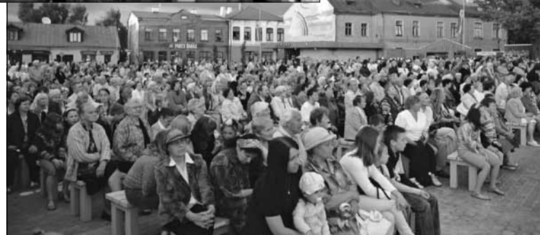
Jēkabpiliēšu svētkos ir tik daudz, ka vienā foto visus iekļaut nevar