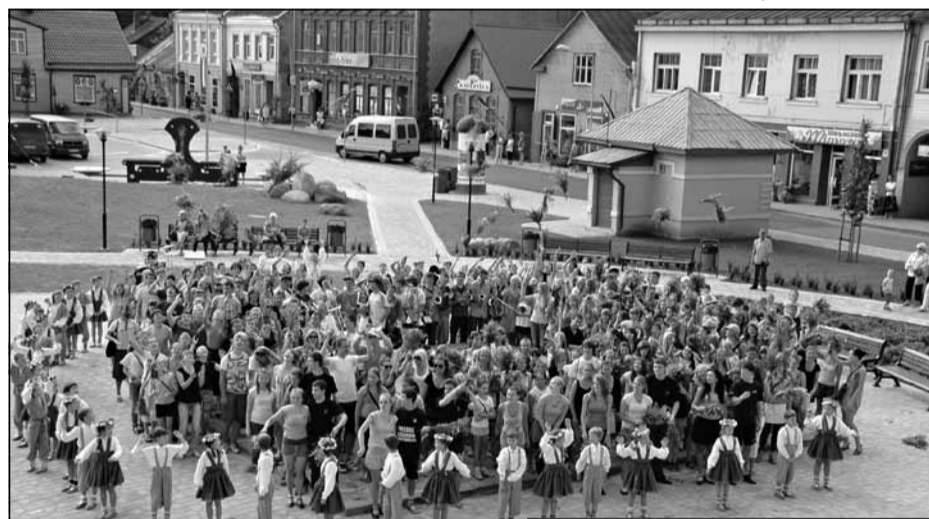
Šeit ir 473 dziesmu svētku dalībnieki, kuri godam pārstāvēja mūsu pilsētu svētkos