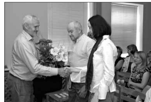
Pilsētas svētku priekšvakarā notika grāmatas „Zīdošais skaistums” atklāšana