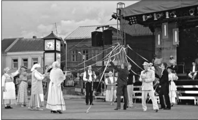
Iegriežas Vecpilsētas laukuma svētku karuselis