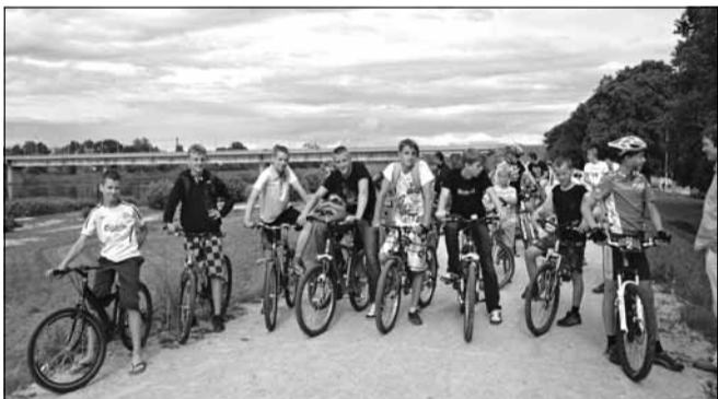
Arī šogad Pilsētas svētkos sportisku aktivitāšu cienītāju netrūka