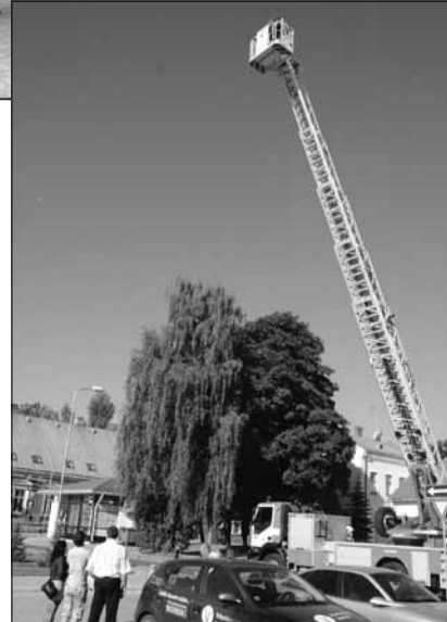
Lai temūzinātu vēl nebijušu Dziesmu svētku dalībnieku kopskatu no putna lidojuma, palīgā nāk VUGD Jēkabpils nodaļa