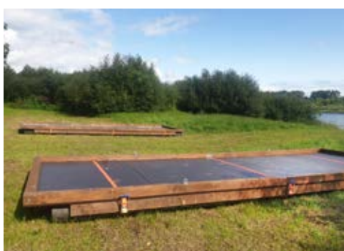
"Plosts Jēkabs II" realizēšanu.

Plosts "Jēkabs I" tika iegādāts 2017. gadā. Plostam bija nepieciešama pārbūve, lai to varētu droši izmantot. Nesošās plostas konstrukcijas bija bojātas, nepieciešama bija arī grīdas plākšņu nomaiņa un citi atjaunošanas darbi, kā arī jauna aprikojuma iegāde. Radās ideja par projekta