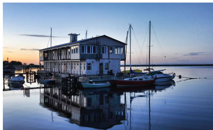
Laivu piestātne Engurē