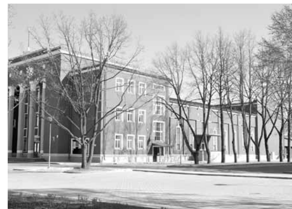
Krustpils Kultūras nams