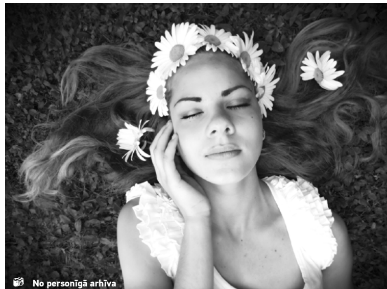
No personīgā arhīva

Šie divi lauki savā starpā nepārtraukti cīnās, bet spēcīgāka parasti ir apziņa, un tādēļ sapņu uzdevums ir atbrīvot zemapziņas enerģiju, lai tā neizkļūtu ārā dienas laikā. Tad rodas jautājums, kāpēc sapņi dažreiz ir tik parasti jeb ikdienišķi. Piemēram, trauku mazgāšana vai krekla gludināšana. Bieži vien šīm situācijām nav zemteksta vai nozīmes,