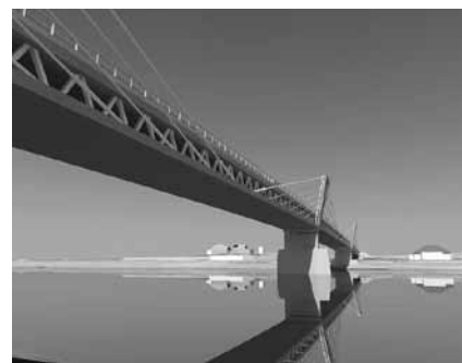
Ekstradozētās sistēmas tilts