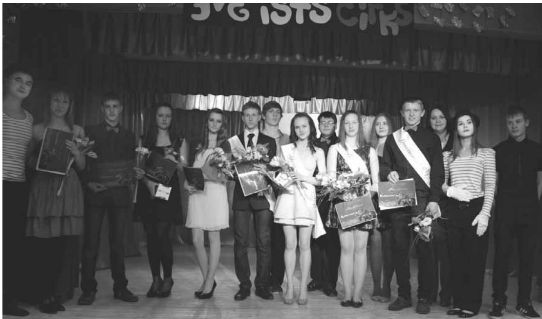
Dalībnieki gandarīti par piedalīšanos konkursā.

Dalībnieku mājas darba uzdevums bija sagatavot priekšnesumu, kas atbilst tēmai "Cirka numurs" vai "Tas tik būtu cirks, ja...". Visi dalībnieki bija ieguldījuši pamatīgu darbu, lai pirms konkursa sagatavotu kopīgu deju un katrs savu mājasdarbu. Pēc sarunām ar vecākiem un skolasbiedriem sapratām, ka divas konkursā pavadītās stundas skatītājiem bija jauks, ar smaidu uz lūpām pavadīts laiks. Daudzi dalībnieki atzīst, ka, piedaloties konkursā, viens no galvenajiem ieguvumiem bijis tas, ka patīkami mainījās domas par pārējiem – iepriekš mazāk pazīstajiem paralēlklasesbiedriem. Viss