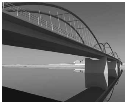
Daudzslaidumu loku tilts