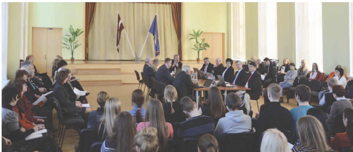
Jēkabpils 2. vidusskolas audzēkņi skolas telpās pirmo reizi piedalās Domes sēdē.

15. martā norisinājās jau trešā Jēkabpils pilsētas Domes izbraukuma sēde kādā no Jēkabpils izglītības iestādēm, šoreiz – Jēkabpils 2. vidusskolā. Izbraukuma Domes sēdes tiek rīkotas ar nolūku sniegt jauniešiem iespēju iepazīt pašvaldības un Domes darbu, lēmumu pieņemšanas procedūru pašvaldībā, kā arī piedalīties sēdes norisē un pēc tās Domes deputātiem uzdot sev interesējošos jautājumus.