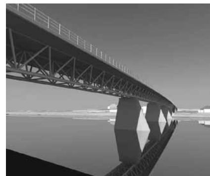
Daudzslaidumu kopnes tilts