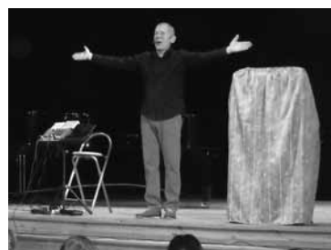
Didzis Rijnieks koncerts „Par ko kļūt?”

Pirmsskolas izglītības iestāde „Auseklītis” bija viena no pirmsskolas izglītības iestādēm, kura atsaucās, uzaicinājumam, piedalīties un organizēt pasākumus projekta „Karjeras nedēļa” ietvaros no 07.līdz 11.10.2013.