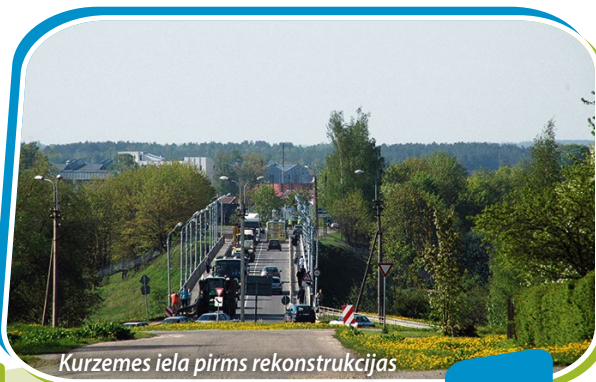
Kurzemes iela pirms rekonstrukcijas