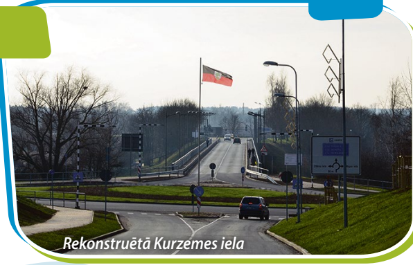
Rekonstruētā Kurzemes iela

Projekta ietvaros tika veikta ielu seguma un krustojumu (Brīvības – Neretas ielu, Kurzemes – Rīgas ielu, Vienības – Brīvības ielu) pārbūve, nepieciešamo komunikāciju pārbūve vai ierīkošana (ievērojot komercdarbības atbalstam noteiktos ierobežojumus), lietus ūdens kanalizācijas ierīkošana, teritorijas labiekārtošana, pieturvietu izbūve un aprikošana, tilta un tā aprikojuma renovācija.