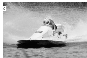
Latvijas čempionāts ātruma laivām 2. posms