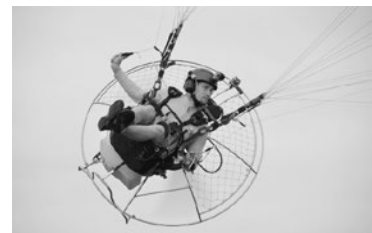
Motoparaplānu sacensības „Jēkabpils Kausis 2014”