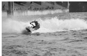
Latvijas čempionāts ūdensmotocikliem, 2. posms