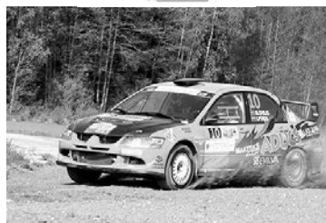
Latvijas čempionāts rallijsprintā „Viduslatvija 2014”, 4. posms