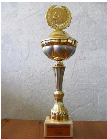
Vīnē iegūtais Zelta kauss