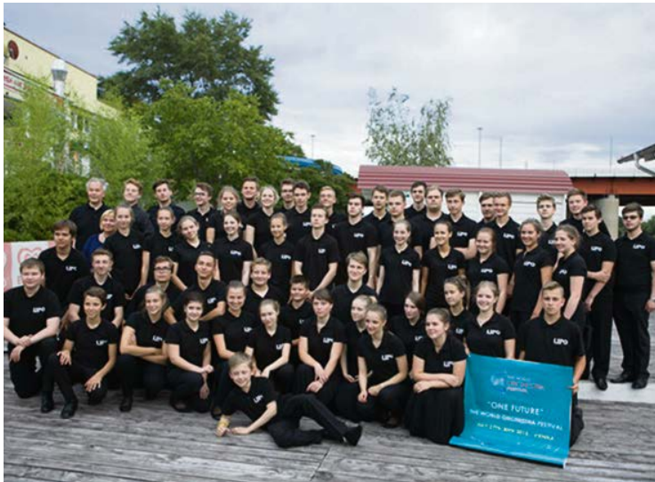
Latvijas Jauniešu pūtēju orķestris Vīnē

Man ļoti patīk muzicēt kopā ar ģimeni. Ņemot vērā to, ka visi mūsu ģimenē esam mūziķi, pilnīgi pašsaprotami bija nodibināt muzikālo apvienību „Muskarieksts”. Kopā radām interesantas idejas diviem saksofoniem, taustiņinstru-