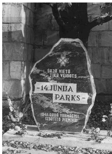
Piemiņas akmens 1941. gada 14. jūnijā izvestajiem Jēkabpilī, Lāčplēša un Parka ielas stūrī

1655. gadā Polijas–Zviedrijas un Krievijas kara rezultātā miestā iepretim Krustpilij ieklūst liels skaits bēgļu.