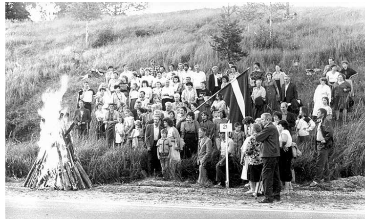
Jēkabpīliešu akcijā „Liesmojošais Baltijas ceļš” 1991. gada 23. augustā