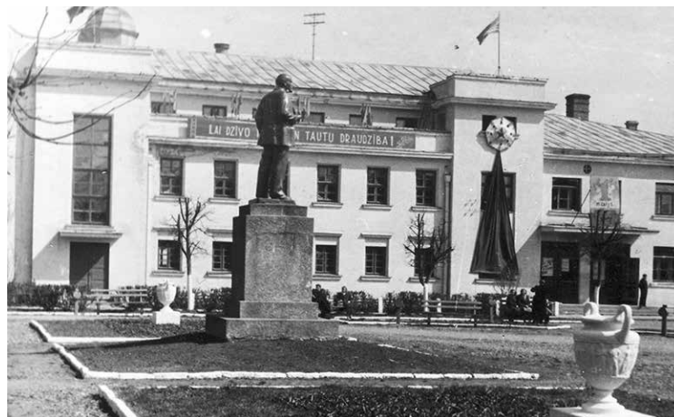
Leņiņa piemineklis pie tagadējā Tautas nama 1965. gadā