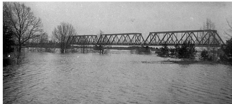
Zelķu dzelzceļa tilts. 20. gs. 30. gadi