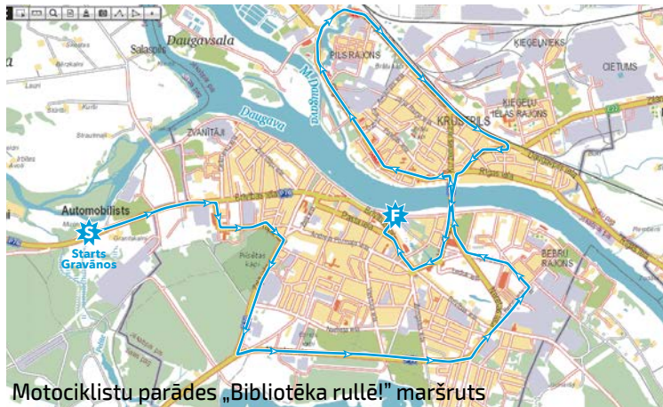
Motociklistu parādes „Bibliotēka rullē!” maršruts

moto klubu „Old Sharpers”. (Maršruts: Salas pagasta „Gravāni” – Brīvības iela – Stadiona iela – Zaļā iela – Neretas iela – Bebru iela – Vienības iela – Rīgas iela – Varoņu iela (līdz Krustpils Svētā Nikolaja pareizticīgo baznīcai Zilnā ielā) – Rīgas iela – Vienības iela – Brīvības iela – Pasta iela – Viestura iela – laukums pie Justīcijas nama). Retro motociklu izstāde un dažādas atrakcijas moto kluba „Old Sharpers” vadībā laukumā pie Justīcijas nama notiks no plkst. 12.00.