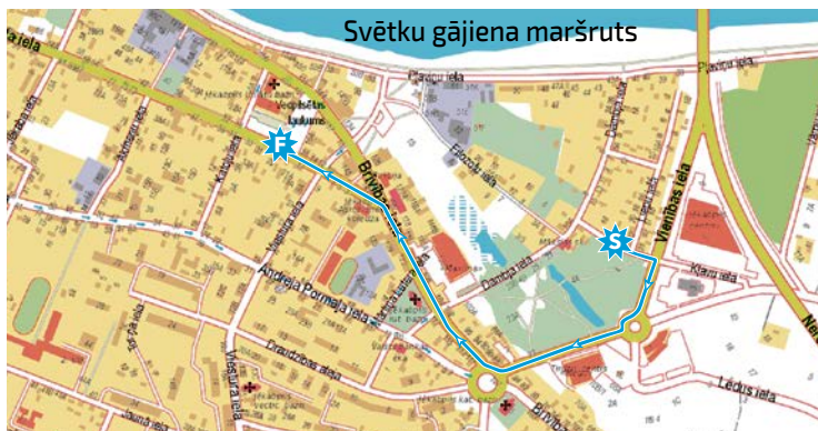
Svētku gājiens maršruts

Pieteikšanās gājienam līdz 4. augustam, rakstot uz e-pasta adresi info@jpk.lv. Pieteikumam jāpievieno divi sevi raksturojoši teikumi. Gājienam lūdzam sagatavot atpazīšanas zīmi. Pulcēšanās gājienam un stāšanās pie Kena parka Kļavu ielā. Gājiens maršruts: Vienības iela – Brīvības iela – Pasta iela – Vecpilsētas laukums.