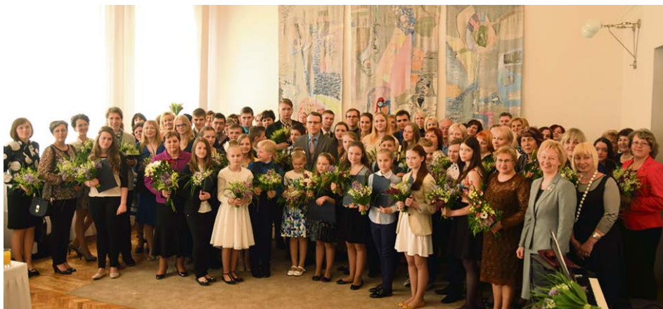
Maija nogalē Jēkabpils pilsētas dome ar pilsētas pašvaldības atzinības rakstiem un naudas balvām apbalvoja izglītības iestāžu mācību priekšmetu valsts olimpiāžu, mākslas un mūzikas profesionālās ievirzes, mākslinieciskās pašdarbības kolektīvu un individuālo izpildītāju valsts nozīmes konkursu, festivālu un sacensību laureātus un pedagogus