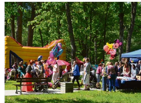
30. maijā Jēkabpili norisinājās Bērnu svētki un krāšņais XI Latvijas skolu jaunatnes dziesmu un deju svētku ieskaņas koncerts „BURT(u)BURVĪBA JĒKABPILĪ”