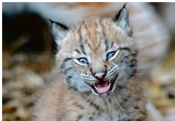
18. jūnijā Rīgas Zoodārzā mītošajiem lūsēniem tika doti jēkabpiliešu izvēlēti vārdi – Jēkabs, Pērle un Ambera