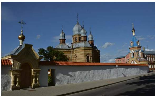
Četri Jēkabpils dievnami šogad piedalījās pasākumā „Baznīcu nakts”. Baznīcu nakts ir kultūras notikums, kas kristīgo draudžu baznīcās notiek vasaras sākumā, jūnijā. Tas ir laiks, kad baznīcā ienākt citādi un iepazīt kultūras un garīgās vērtības