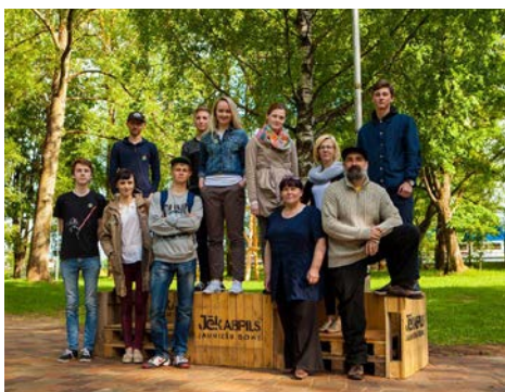
4. jūnijā Kena parkā norisinājās zibakcija „Parkojam kopā!”, kuras laikā tika aptaujāti parka apmeklētāji par viņu ierosinājumiem Jēkabpils parku attīstībai. Apkopotos priekšlikumus un parku attīstības viziju akcijas rīkotāji prezentēs jūnija beigās