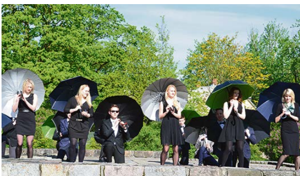
Maija nogalē Jēkabpils skolās notika svinīgi Pēdējā zvana pasākumi, bet jūnijā izglītības iestādēs notiks izlaidumi