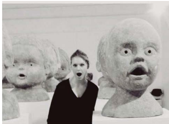
Ko novēli jauniešiem, kas turpinās darboties avīzes veidošanā?

Jēkabpils jauniešu dienā notika arī Jauniešu domes rīkotās sacensības pludmales volejbolā, galda tenisā, dambretē, novusā, galda hokejā. Pirmo reizi pasākuma