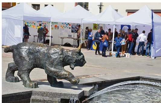
Lai iepazīstinātu jauniešus un citus interesentus ar Eiropas Savienības sniegtajām iespējām, Vecpilsētas laukumā ar dažādām aktivitātēm 8. maijā tika atzīmēta Eiropas diena