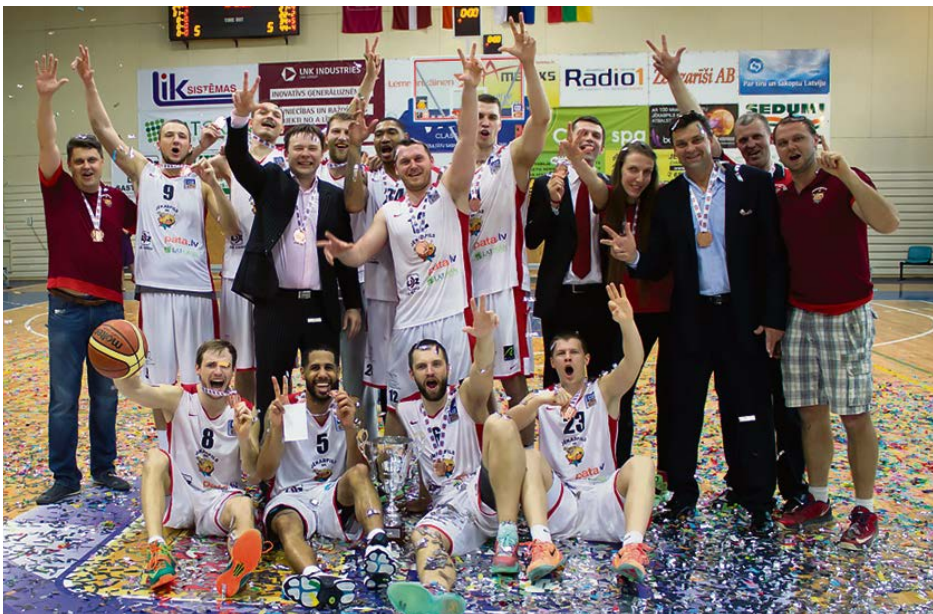
Leļojamies – basketbola klubs „Jēkabpils” otro sezonu pēc kārtas izcīna bronzu!