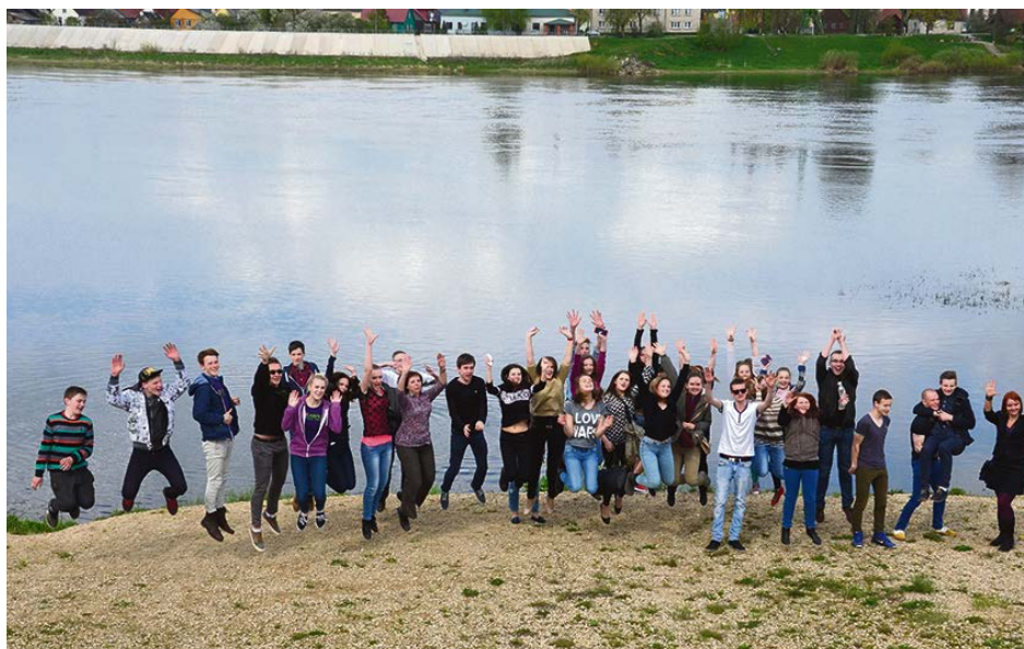
Lai iepazītos ar Jēkabpils pilsētas pašvaldības, Jēkabpils jauniešu domes un skolu pašpārvalžu pieredzi, Jēkabpili maijā apmeklēja Talsu jaunieši