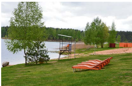
Oficiāli atklājot peld sezonu, maijā Radžu ūdenskrātuves pludmalē jau sesto gadu tika pacelts Zilais karogs. Šopavasār pludmalē veikti arī būtiski labiekārtošanas darbi