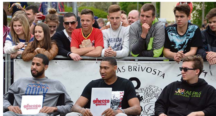
Maijā jau sesto gadu pēc kārtas tika aizvadīta Jēkabpils jauniešu diena, pulcējot aptuveni divarpus tūkstošus dalībnieku un apmeklētāju!